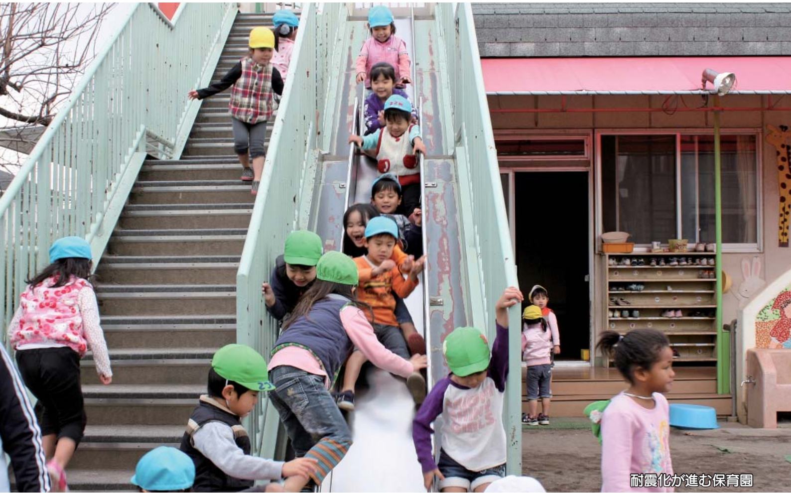
耐震化が進む保育園