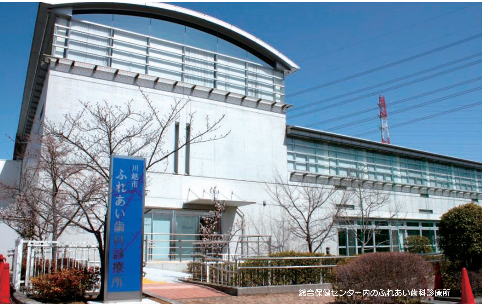
総合保健センター内のふれあい歯科診療所