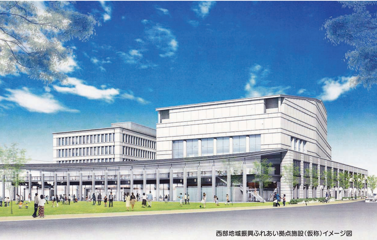
西部地域振興ふれあい拠点施設(仮称)イメージ図