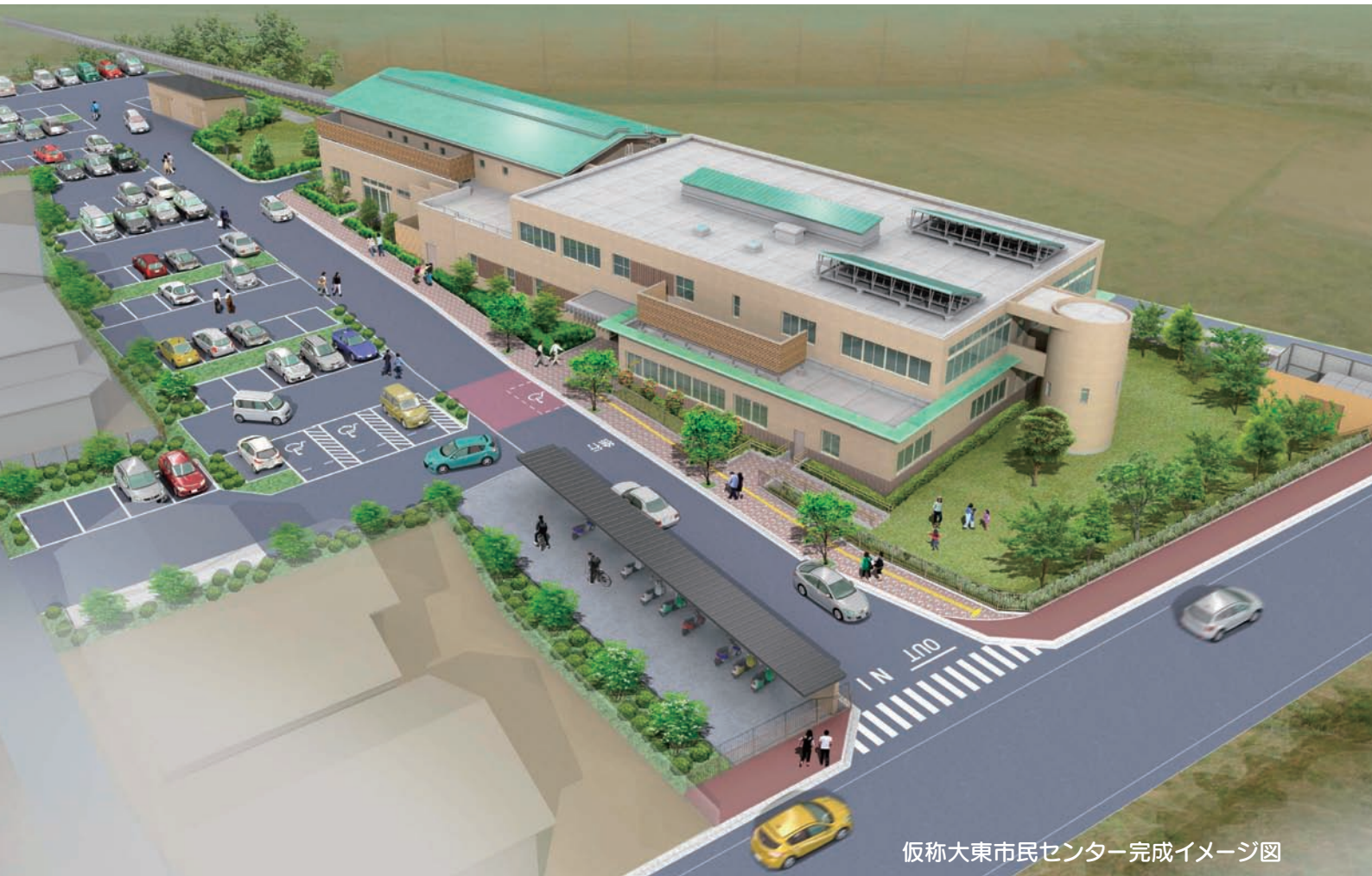
仮称大東市民センター完成イメージ図