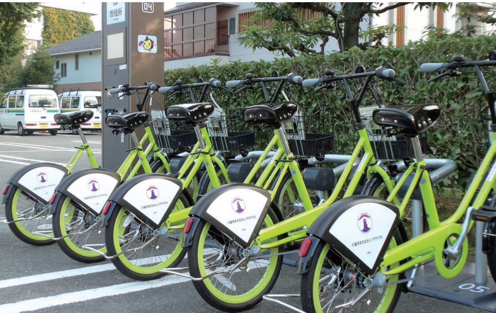
まちなかレンタサイクル(コミュニティサイクル社会実験)でのサイクルポート