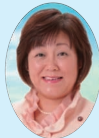
副委員長 若狭 みどり 公明党議員団