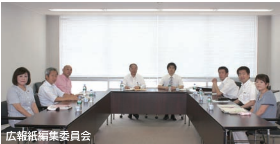
広報紙編集委員会