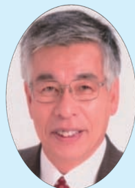
委員 本山 修一 日本共産党議員団