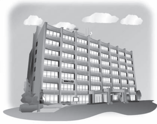
21件の市長提出議案を審議しました。 結果は3ページの議決結果一覧表をご覧ください。