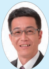
副委員長 中村 文明 公明党議員団