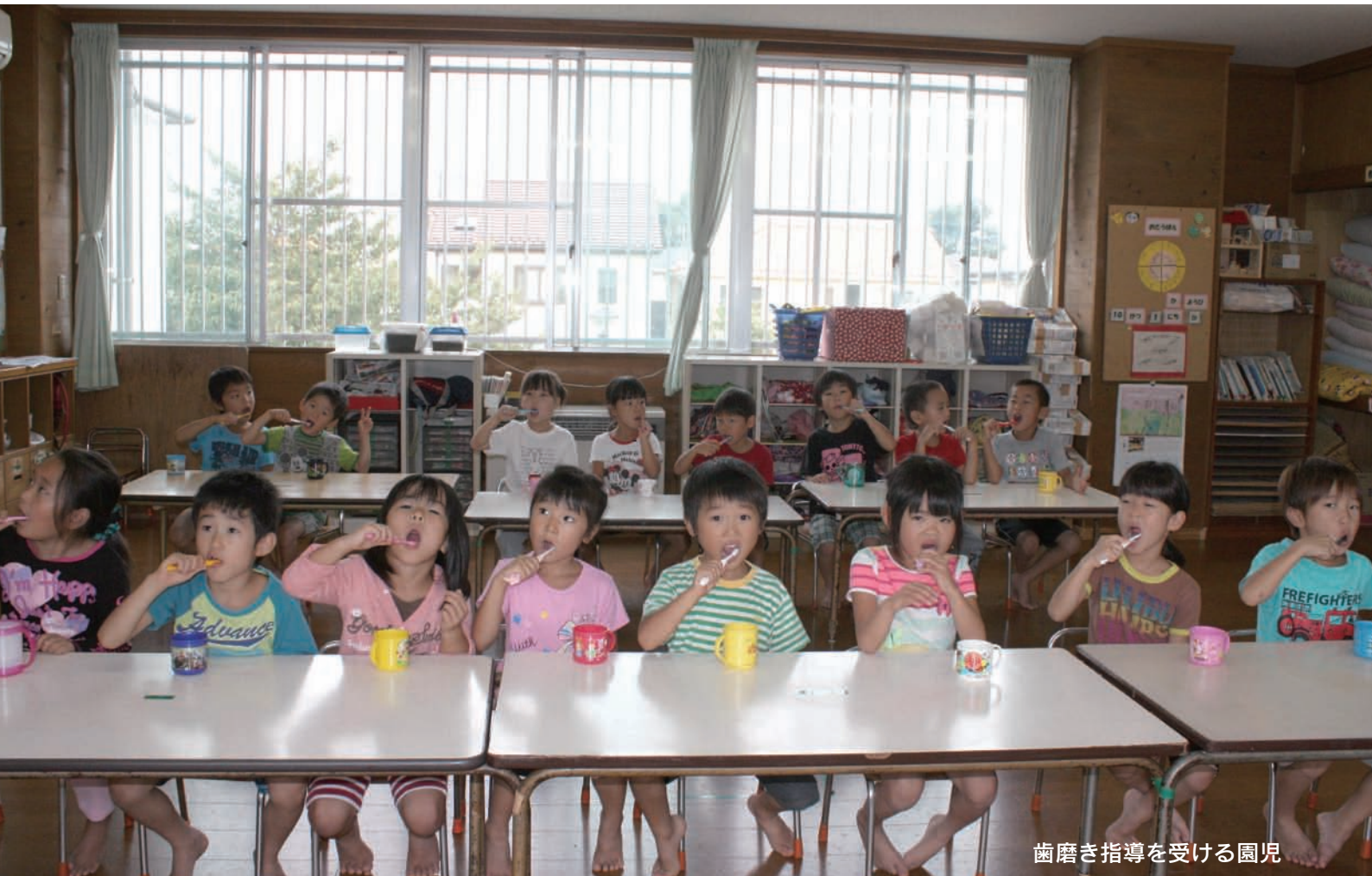
歯磨き指導を受ける園児