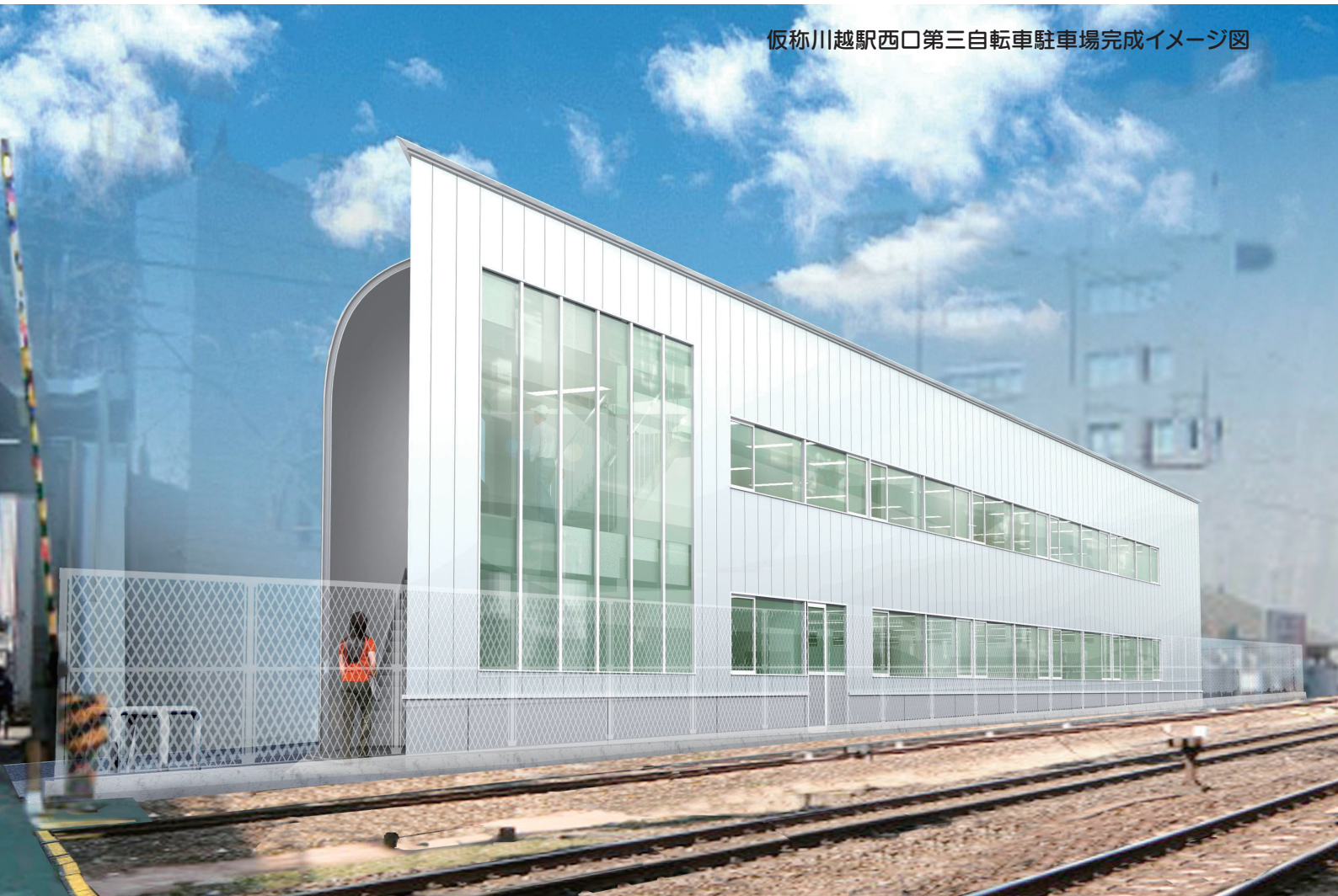
仮称川越駅西口第三自転車駐車場完成イメージ図