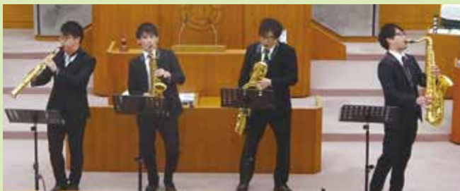
※議場コンサートは、東京2020参画プログラムの認証を受けています。

12月2日、今定例会の開会日に議場コンサートを開催しました。今回は、平成30年度川越市人材発掘公開オーディションで選ばれた団体の一つである「Vario Saxophone Quartetto」により、「カプースチン作曲 演奏会用練習曲より 第1楽章」、「日本の四季メドレー」、「ボヘミアンラプソディー」の3曲の演奏が行われました。