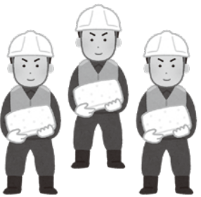
水防団活動 労働者協同組合

答危機管理監 本市水防団員の費用弁償の額については、県内他団体の水防団の団員に係る費用弁償の額と比較し、低い額となっている。このため、適正な費用弁償の額につ