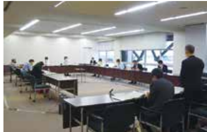
常任委員会での審査の様子

【常任委員会とは】 地方公共団体の議会が、一定の部門の当該地方公共団体の事務に関する調査および議案等の審査を行わせるため、条例で定め、常設する委員会です。