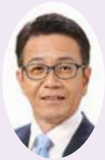
委員 中村 文明 公明党議員団