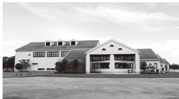
改修整備工事が行われる農業ふれあいセンター