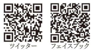
ツイッター フェイスブック

【川越市議会ホームページ】から 【市議会公式SNS】の順にクリックしてください。2次元コードからもアクセスできます。