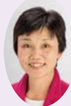
委員 池浜 あけみ 日本共産党議員団