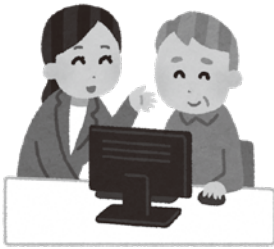
高齢者デジタル対応

答 市長 団塊の世代が75歳以上の高齢者となり現役世代の負担が大きく上昇することが想定される中、現役世代の負担上昇を抑えながら、全ての世代が安心できる社会保障制度の構築が求められ、