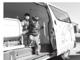
保育ステーションの送迎バス