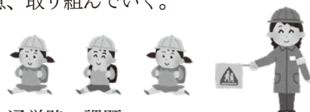
福原地域の通学路の課題

答 建設部長 県道川越入間線以北の拡幅については、現在、具体的な計画はないので、今後、市内全体の幹線道路網整備の進め方の中で、検討していきたいと考えているが、まずは、現在事業中の区間について、早期完成を目指し、鋭意、取り組んでいく。