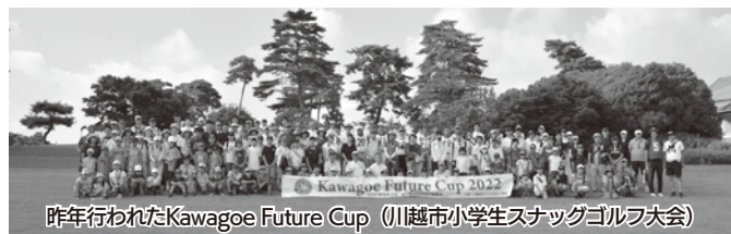
オリンピックレガシー

答 学校教育部長 小学校のクラブ活動は、児童の自主的、実践的な取り組みとなることが大切であるため、まずは、児童がスナッグゴルフに対して、興味や関心があることが前提になるものと考えている。