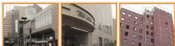
川越プリンスホテル 川越東武ホテル 川越第一ホテル

市内には複数のホテルがあり、駅や観光地も近くにありません。部屋数も多く、Wifi等の設備も整っています。