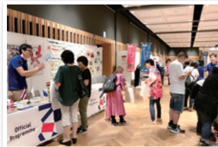
東京2020大会に向けた1年前イベント in川越

東京2020大会に関するさまざまなイベントを開催しています。 家族や友人と参加して、大会を盛り上げましょう！