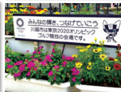
川越駅東口デッキ上（植栽・看板）