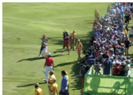
リオ2016オリンピックの様子