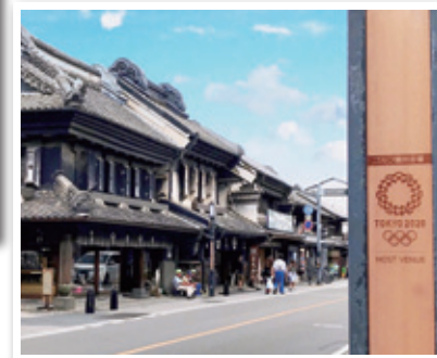
一番街（木製プレート）