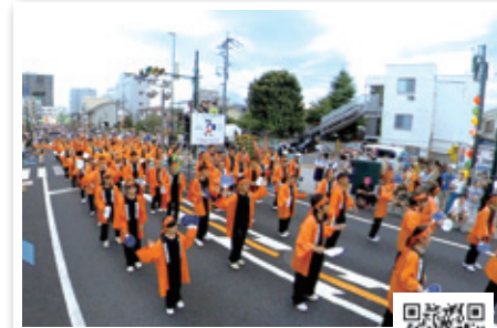
2020人で踊ろう！東京五輪音頭-2020-