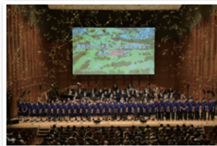
オリンピックコンサート2019 in川越