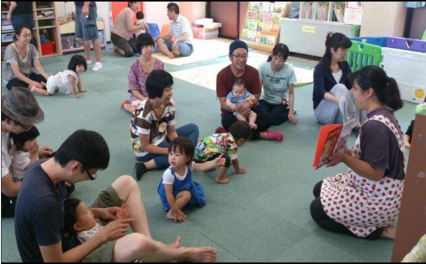
○「つどいの広場」での読み聞かせの様