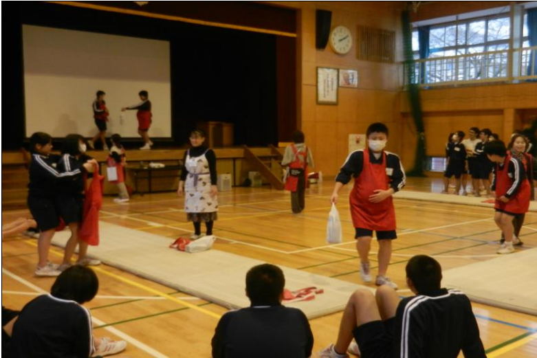
○「いのちの講座」 妊婦体験の様子