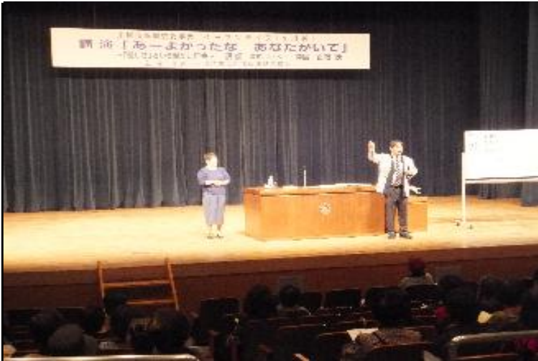
○「イーブンライフ in 川越」講演会の実施状況