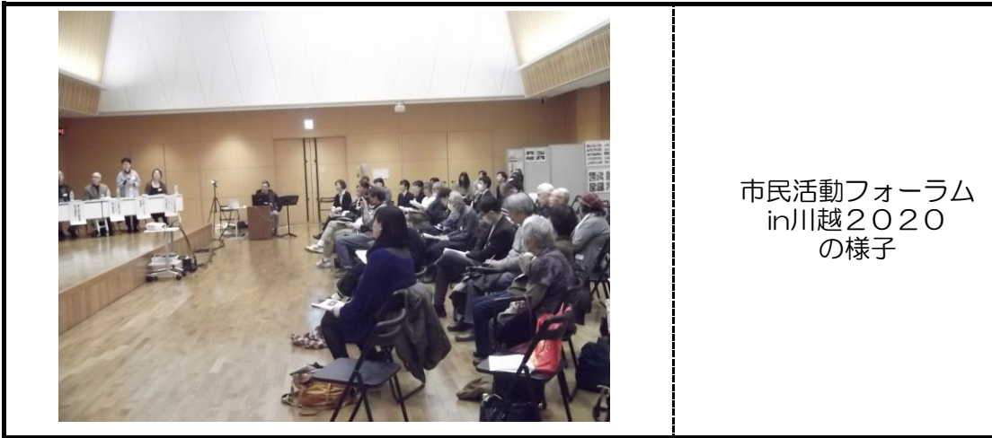
市民活動フォーラム in川越2020 の様子