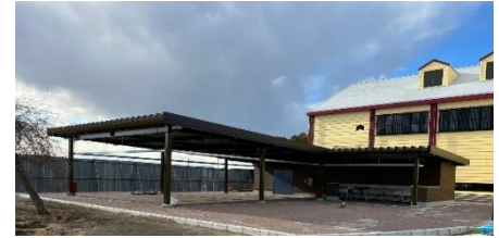
大屋根広場 (バーベキュー場)