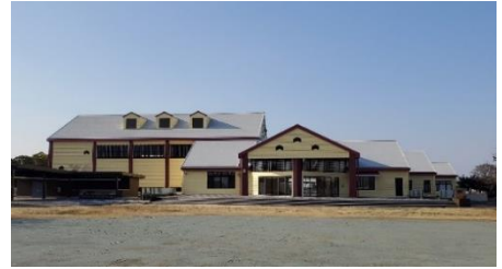
農業ふれあいセンター