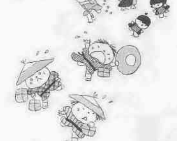
さし絵・文 池原昭治氏