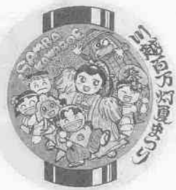
ワッペンデザイン