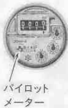
パイロットメーター

パイプの老朽化や、蛇口の締め忘れなどが原因で大切な水が漏れてしまうことがあります。漏水かなと思つたら、家中の蛇口を全部締め、メーターのパイロットマークを確認してください。少しでも回っていたら漏水の可能性が