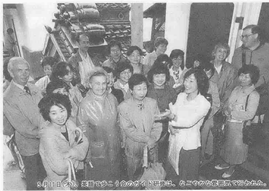
5月11日(木)、英語で歩こう会のガイド研修は、なごやかな雰囲気で行われた。

最近、歴史と蔵のまち・川越を訪れる熱心な外国人観光者の姿が増えています。反面、城下町の入り組んだ道は、外国人にとつて歩きづらい印象があるようです。 そんな現状の中、「川越を英語で歩こう会」が、二月に発足。川越の良さを外国人に紹介しようと、文化財や歴史などの英訳に取り組みうちに、メンバーは郷土への愛着心を高めてきたようです。