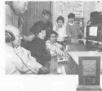
むきな努力を続けるのです。

道具などを映像によって次世代に残したいという衝動がこのクラブのエネルギーになっているようです。