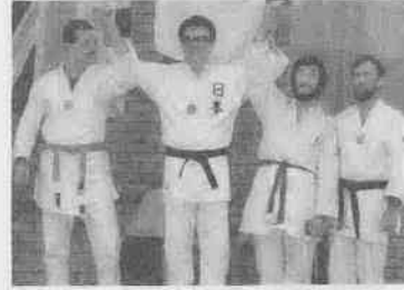
国際視覚障害者柔道大会で連覇

今年で開館二十周年を迎える勤労青年ホームは「クイック」の愛称で活発な活動を繰り広げています。十一月十一日(土)に行われたウルトララリークイズでは、七十六チーム、約二百五十人が出場。参加者は、市内の各ポイントで川越にちなむ問題を解き、次のポイントへ。知力と体力に勝敗の行方を託してまちを東奔西走しました。