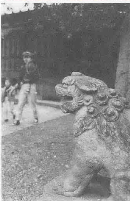
こま犬がたまたま通りかかった親子をながめていた（写真左）。

パート群にはさまれた古川排水路が一望できる（写真表紙）。この水路は、野鳥たちの楽園。水辺に近づくと、水鳥たちの羽音や鳴き声がにぎやかだ（写真上）。 十六号をくぐって南へ。堤は、入間川と荒川の合流点を左に見下ろしながら、南東へ延びている。JR川越線を越え、右側にお寺と神社の屋根が見えてくる。灌頂院とほろかけ祭りにぎわう古尾谷八幡神社だ。 この日の神社は、人影もまばら。こま犬がたまたま通りかかった親子をながめていた（写真左）。