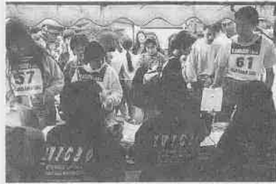
ウルトラ・ラリークイズ

西文化会館が開館一周年を迎えました。昨年の文化の日以来、同館のこれまでの利用者は、六万人を超え、文化活動の拠点として広く活用されています。十一月十二日(日)には、記念のイベントが催され、牧声会とコーラル・レ・フルールが競演。つめかいたコーラスファンは、美しいハーモニーを十分にたんのうしたかと思えます。