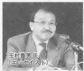
玉村豊男氏 (エッセイスト)

の風土、風景、風味によって育まれ、生活と共に維持されてきた日本の「食文化」が求められているのです。「ふるさとの味」「おふくろの味」の危機がささやかれる現在、シンポジウムの内容は、川越の食文化についても考える良い機会になったのではないのでしょうか。