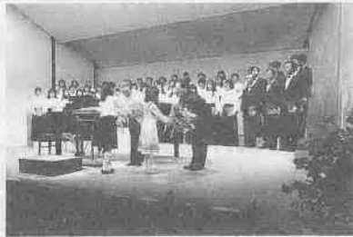
牧声会とコーラル・レ・フルール