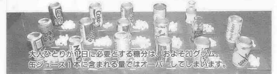
大人ひとりが1日に必要とする糖分は、およそ20グラム。缶ジュース1本に含まれる量ではオーバーしてしまいます。