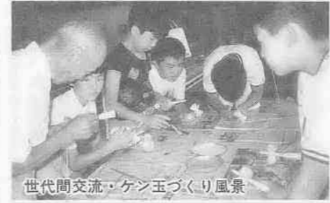
世代間交流・ケン玉づくり風景

今年もあとわずか、新しい年を迎える時期となり、社協では今、恒例の歳末助け合い運動を実施しています。この運動は、「みんながそろって明るいお正月」を迎えられるよう、住民の皆さん、自治会をはじめとする関係機関・団体等、市民総ぐるみで、地域の要援護者へ、物心両面の援護活動を行うものです。 二つ目は「歳末福祉事業」で、援護対象世帯(者)への金銭的な援助だけでなく、精神的な支援・地域とのふれあいの機会づくりを推進し、住民の福祉を高める活動です。例えば、「世代間交流」「友愛訪問」や「福祉懇談会」の開催、「ひとり暮らし老人給食サービス」の実施等、地域の特性を生かしながら援護活動を行うものです。