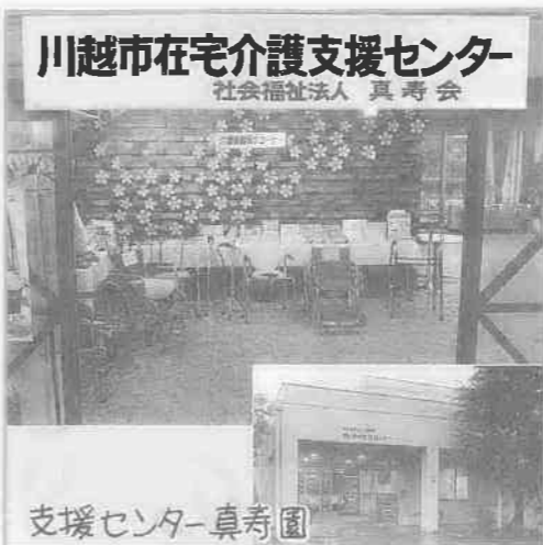
支援センター真寿園

※右記以外の時間帯を希望する方は、事前に同センターまでご連絡を。また、緊急の場合は、右記の時間帯以外でも併設施設・真寿園の職員が対応しています。 ※十二月二十八日(金)～一月四日(金)は、休みます。