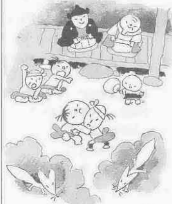
絵と文 池原昭治氏

ました。住職は「お話を聞いて、お寺へ参りしたい」といいました。あくる日の夜、民部さまが供をつれてやってき