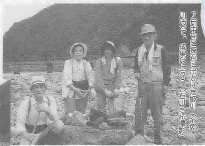
7月中旬に探石に出かけた姫川(糸魚川市)。成果は上々。(石川さん撮影)