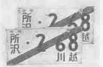
▲臨時運行許可番号標(仮ナンバー)