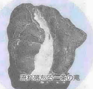
流れ落ちる一条の滝

自然石に美を見出し、眺めて楽しんでる人たちがいます。石に魅せられ、集めているのは「川越愛石会」(会員五十人)の皆さん。