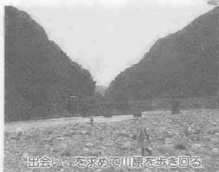
「出会い、を求めて川原を歩き回る

岩壁を伝い落ちる、一条の滝。荒々しく切り立つ山肌。なだらかな山並みにたなびく雲。一つ一つが、一幅の掛け軸を見ようような静寂と壮大さを感じさせる「水石」。