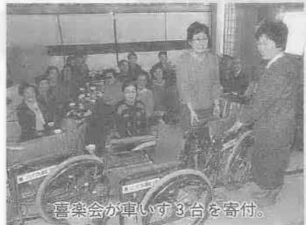
喜楽会が車いす3台を寄付。