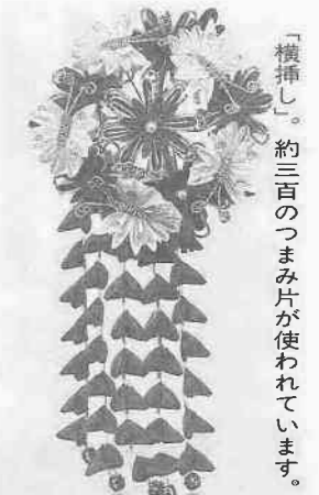
「横挿し」。約三百のつまみ片が使われています。

東京都の伝統工芸品に指定されている髪飾り。作り方は、羽二重(絹織物を正方形に裁断、ピンセットでいくつもつまみ(折りたたみ)、のりを含ませ、台紙やクシに花やチョウの形に並べ、さがりや鈴などを組み込んで、極天