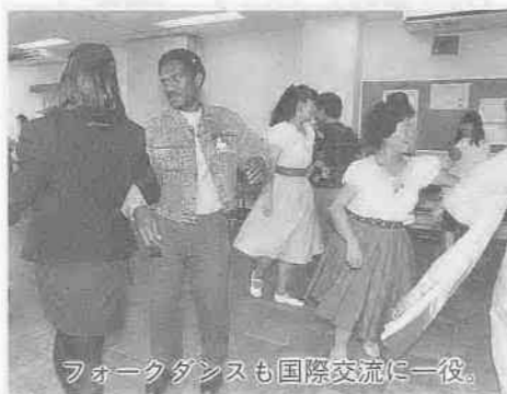
フォークダンスも国際交流に一役。

外国人約三十人を含む約百人が参加した「国際文化交流フォーラム」。十一月十七日(日)、福原公民館で開催されました。四人の外国人パネラーから「日本人は親切」「同じ人間と考えて」「国際交流は、たくさん外国人とつきあうことが大切」「文化の差でぶつかっても、つきあっていくうちに調和が生まれる。そして、良い友達に――」などの発言があった。パネルディスカッション。手と手をつないだフォークダンス、ゲームなどがありました。