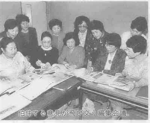
伯仲する意見が飛び交う編集会議