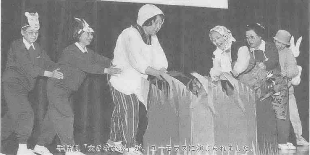
手話劇「大きなかぶ」が、ユーモラスに演じられました。