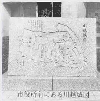
市役所前にある川越城凶

桜の季節には出会いと別れがあり、日ごろお世話になっている新聞記者の方々にも異動の辞令。記者の皆さんの異動は盛岡から着任、甲府へ赴任など広範囲です。多くのまちを見てきた彼らには、川越がどんなまちに映るのか興味津々▶入学、就職、転勤などで川越の暮らしが始まるようになっている方の不安をなくしてくれるのは、まちの持っている魅力かもしれません。皆さんに川越を好きになってもらえるように、人とまちのいい関係が築ける広報づくりに努めています。