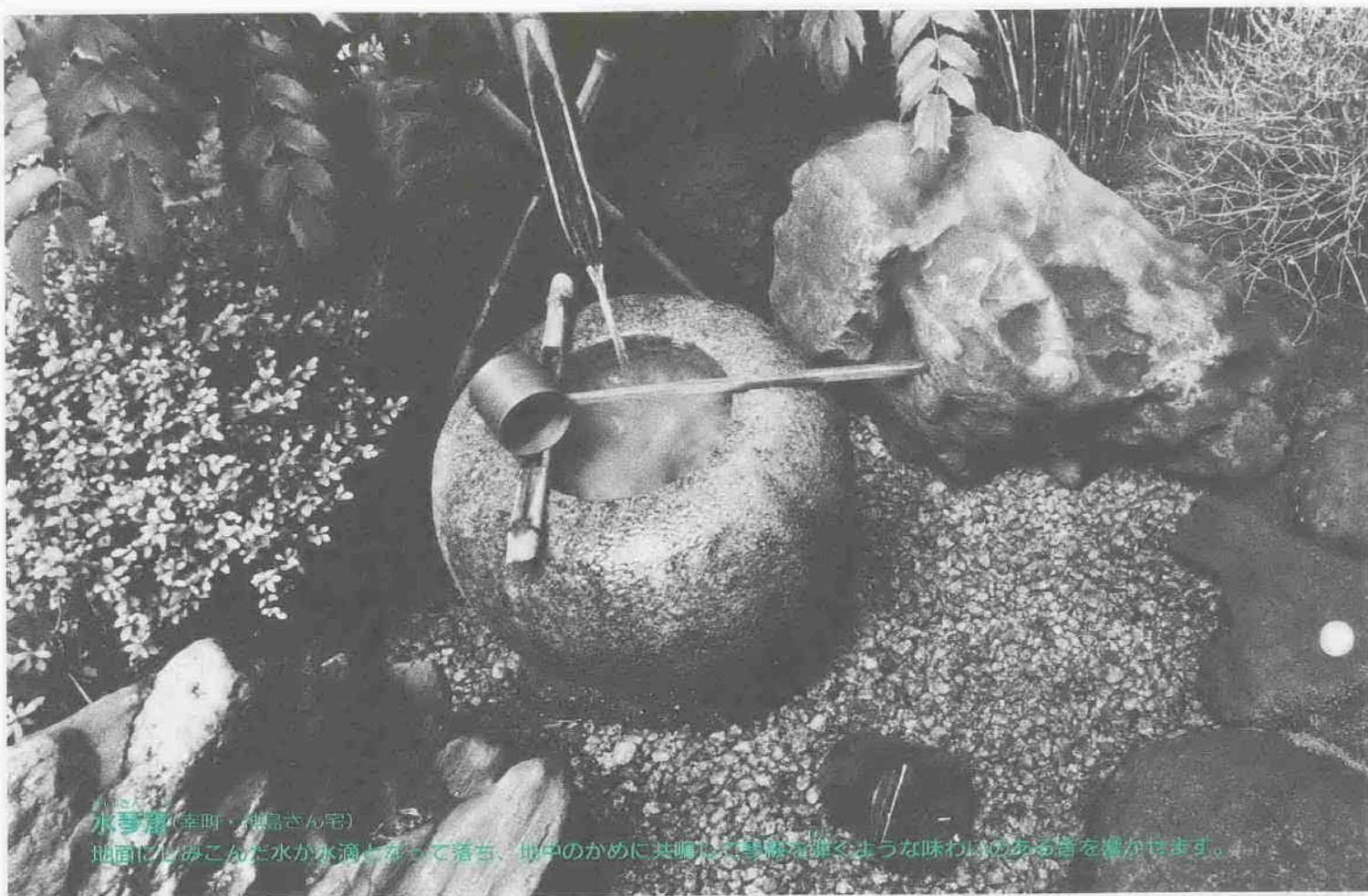
水琴窟(幸町・柳島さん宅) 地面にしみこんだ水が水滴となって落ち、地中のかめに共鳴して琴線を弾くような味わいのある音を響かせます。