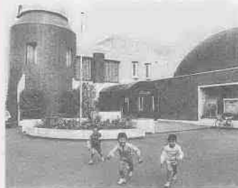
児童センターこどもの城

わが家の庭に、毎年咲くアジサイと、先日買い求めたキキョウ。ふたつの紫が、梅雨時の庭先に彩りを添えています。うっとり感じるこの時期も、視点を変えればそれなりに楽しいもの。とは言え、雨の日の外出は避けたいのが人情▶こんな季節にも頑張っているのは、広報紙を配布していただいている123人。一定期間内に徒歩、自転車、バイクなどで配布するので、普段にも増して天候の悪い時期にはご苦労をかけます。濡らさないように、事故にあわないように、気をつけながら▶ふたつの紫を眺めながら、無事に配布が終わればと思っています。