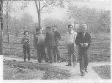
中国の試験場で指導する