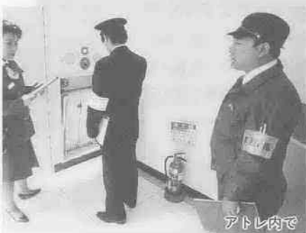
川越地区消防組合では、12月15日から25日までの11日間、歳末特別査察を実施しました。

12月9日(休)、ハンガリー・ポーランド・チェコスロバキアの医師3人が、西文化会館で行われていた3歳児の健康診査を視察。医師たちは「地域ごとに生活形態が異なる自国の状況では、集団保健事業などの普及が難しいが、その重要性を再認識した」と言い、この日の受診率(95%)の高さに驚いていました。