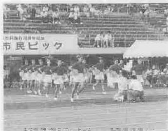
今秋オープンした陸上競技場で。

38ch テレビ埼玉 毎週火曜日 午後5時30分～5時40分 隔午後10時15分～10時25分 ■一部変更になることがあります。あらかじめご了承ください。