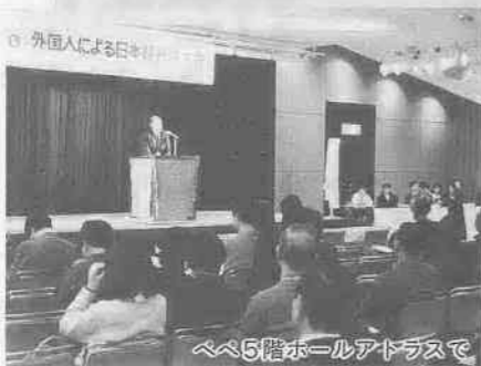
外国人による日本語大会