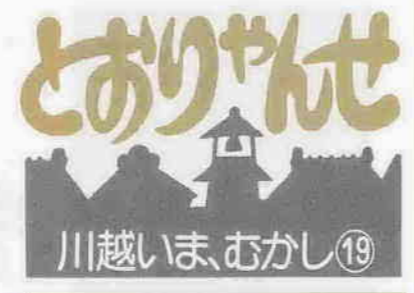
埼玉縣仙波尋常高等小学校 (富士見町)