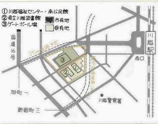
西部地域産業文化センターの建設予定地

建物は、敷地中央にオフィスを中心とした百五十メートル級（地上三十四、五階）の高層棟、その周囲は公共施設を中心とした低層棟。高層棟は、大宮市・ソニックシティの高さ百三十七メートル（地上三十一階）を抜き、県内