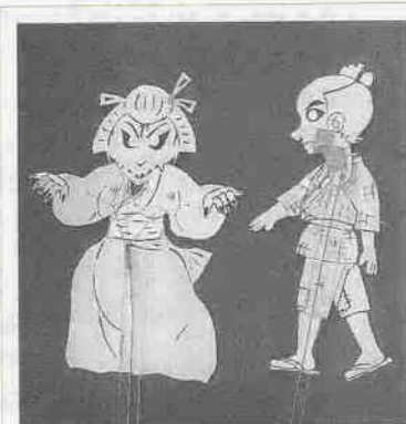
人形の高さは、約30センチメートル。首や手足が動くようになっています。

団員は十二人。三十代から七十代までの女性十一人と男性一人。毎週火曜日の午後、公演に向けて制作に励んでいます。