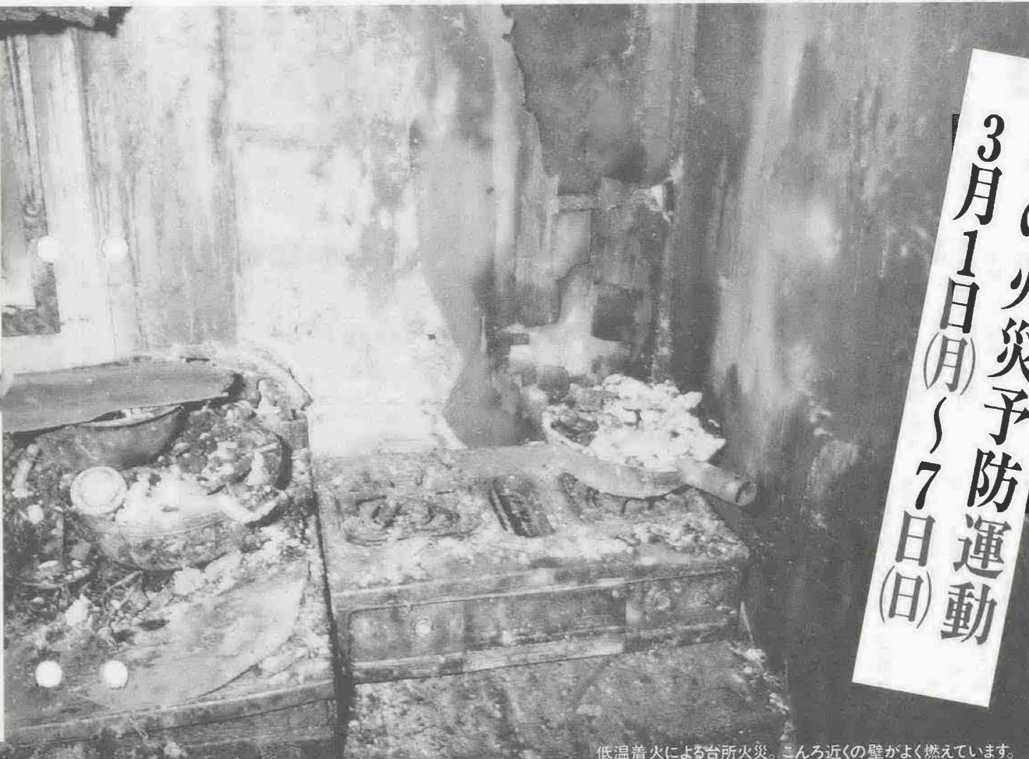
低温着火による台所火災。こんろ近くの壁がよく燃えています。