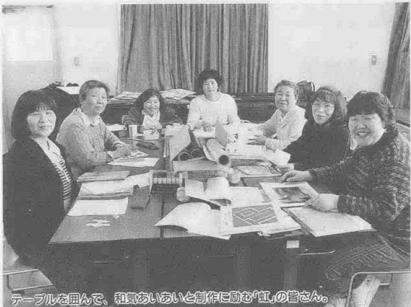
テーブルを囲んで、和気あいあいと制作に励む「虹」の皆さん。

高階公民館で影絵劇をつくる計画は、六年前からありました。昭和六十二年に「高階民話マップづくり講座」を開き、平成元年にイラストマップ「高階おはなし」