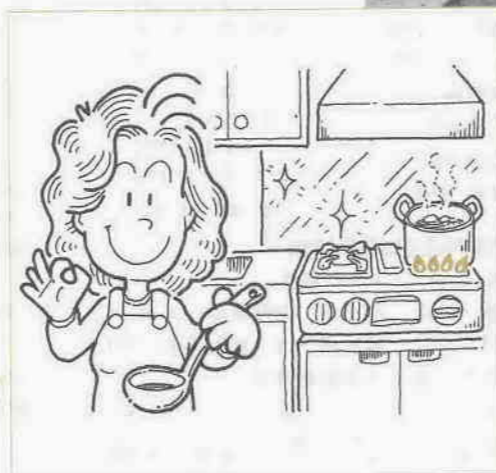
▲料理は作っても火災の原因は作らないでください

毎年三月一日から七日まで、「春の火災予防運動」が実施されます。この季節は、まだまだ暖房が離せず、火災が多く発生します。火災は、財産だけではなく、あなたや家族の命を奪うこともある恐ろしい災害です。ふだんから安全への心構えを忘れずに、日ごろの点検を重ねてください。