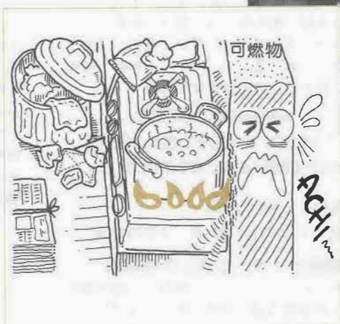
▲低温着火のしくみ