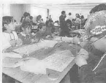
「連だこ作り道場」のようす。

38ch テレビ埼玉 毎週火曜日 午後5時30分～5時40分 再 午後10時15分～10時25分 ■一部変更になることがあります。あらかじめご了承ください。