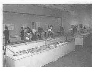
博物館の展示の様子