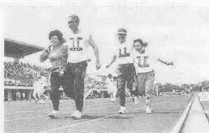
昨年のふれあいスポーツフェスティバルの様子