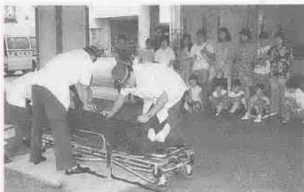
夏休み親子施設めぐり