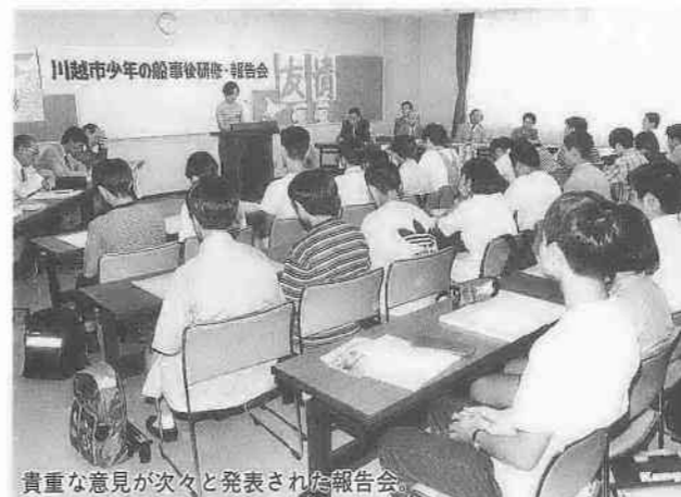
貴重な意見が次々と発表された報告会