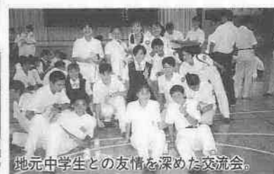
地元中学生との友情を深めた交流会