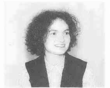
「買い物にはバッグが常識」とニコラさん。

知らせてください。条件が整い、代替地としての契約が成立した場合は、譲渡所得の特例(千五百万円の特別控除)が受けられます。登録できる土地：面積が二百平方メートル以上で公道に接している土地