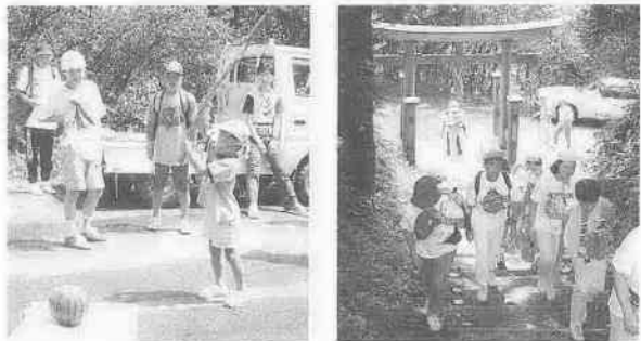
楽しかったすいか割り 八溝嶺(やみぞみね)神社に参拝

ました。コース途中には、名水百選に選ばれたわき水があり、ハイキングの疲れをいやしてくれました。また、八溝山頂付近では、棚倉町の皆さんとちつきやすいか割りをして、いっしょに楽しみました。 川越から参加された皆さんは、この事業を通して棚倉町の方の人情に触れ、自然をたんのうし、第二のふるさとと感じていたようでした。