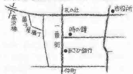
表紙の写真(川越まつり・一番街)

だいぶ日が短くなり、朝晩は少し冷え込んできました。だいだい色の花をつけたキンモクセイの甘い香りが風にのってくると、一段と秋の深まりを感じます▶スポーツや文化にまつわるさまざまな催しがあるこの季節、職員はカメラを抱えて取材に飛び回っています。忙しくもあり、楽しくもありといったところ。取材先で親しく声をかけてくださる方や、「毎号楽しみにしています」というお便りに元気づけられ、読みやすい文章を、心に残る写真をと、編集にも気合いが入ります。これからも、市民の皆さんと行政との「いい関係」を築ける広報紙づくりを進めていきたいと思ひます。