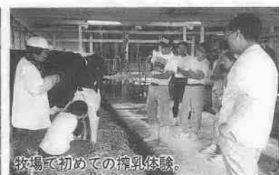
牧場で初めての搾乳体験