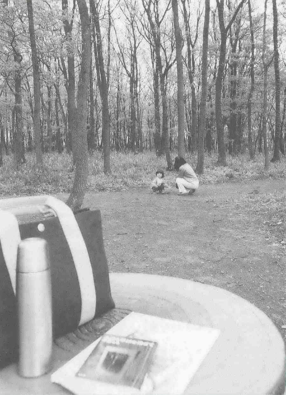
わくわく散歩道シリーズ151 (関連記事は2ページ)