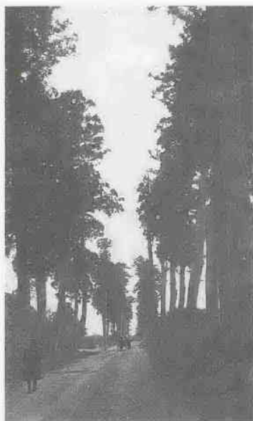
昔の鳥頭坂（撮影年代不明）

「川越市の文化財（川越市教育委員会）」、「川越のあゆみ（川越市）」、「川越市景観百選（川越市都市計画部都市計画課）」を参考にしました。