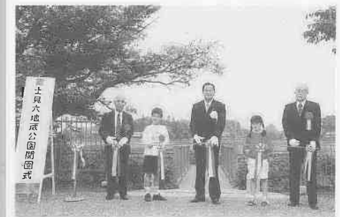
地元の子どもたちといっしょにテープカット

園内には大谷川が流れ、川辺の木々が自生する水辺空間が広がっています。新設された木製の護岸や橋は周りの風景と調和し、環境にやさしい整備がされています。 また、自然の仕組みを学ぶため、生きた教材として活用することができますように、水辺に生育する植物も植えられています。 地域の憩いの場として、ご利用