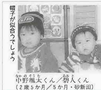
帽子が似合うでしょう