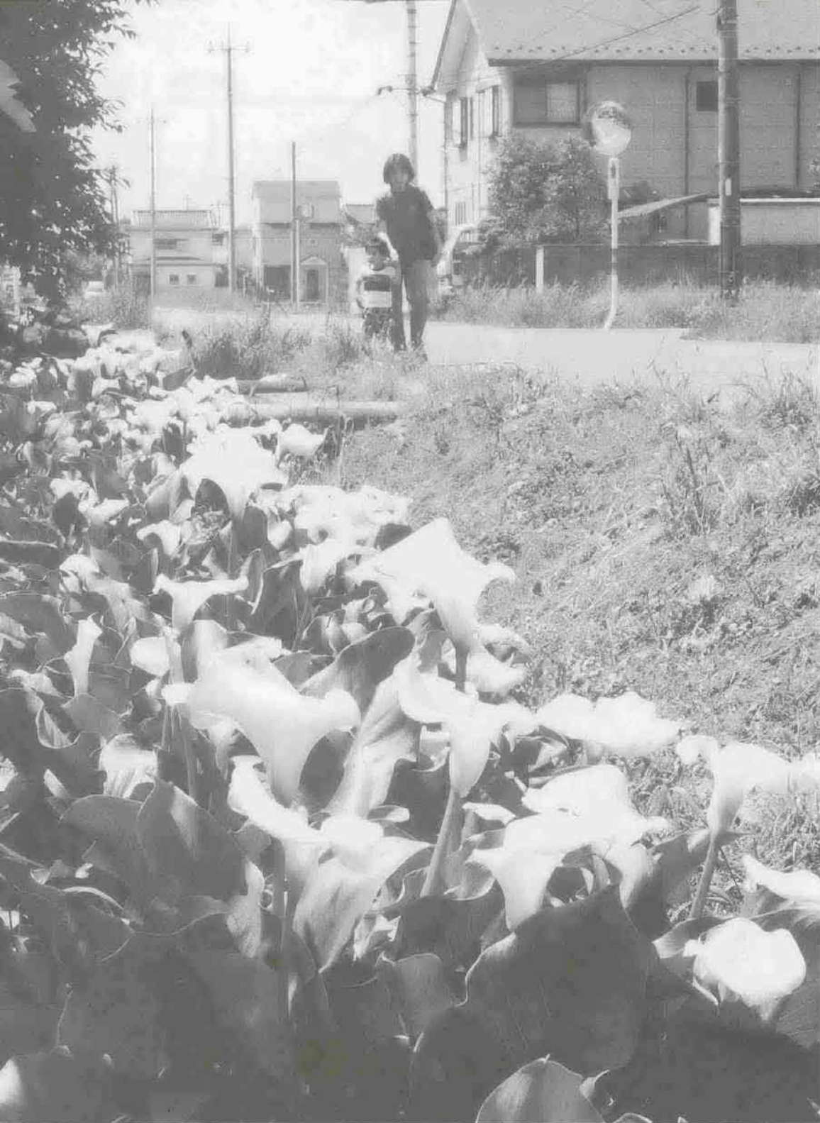
わくわく散歩道シリーズ152 (関連記事は2ページ)