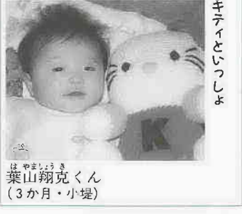
キティといっしょ