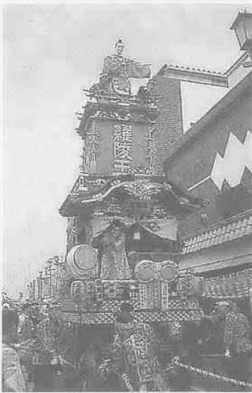
現存する市内最古の山車「羅陵王」(仲町)