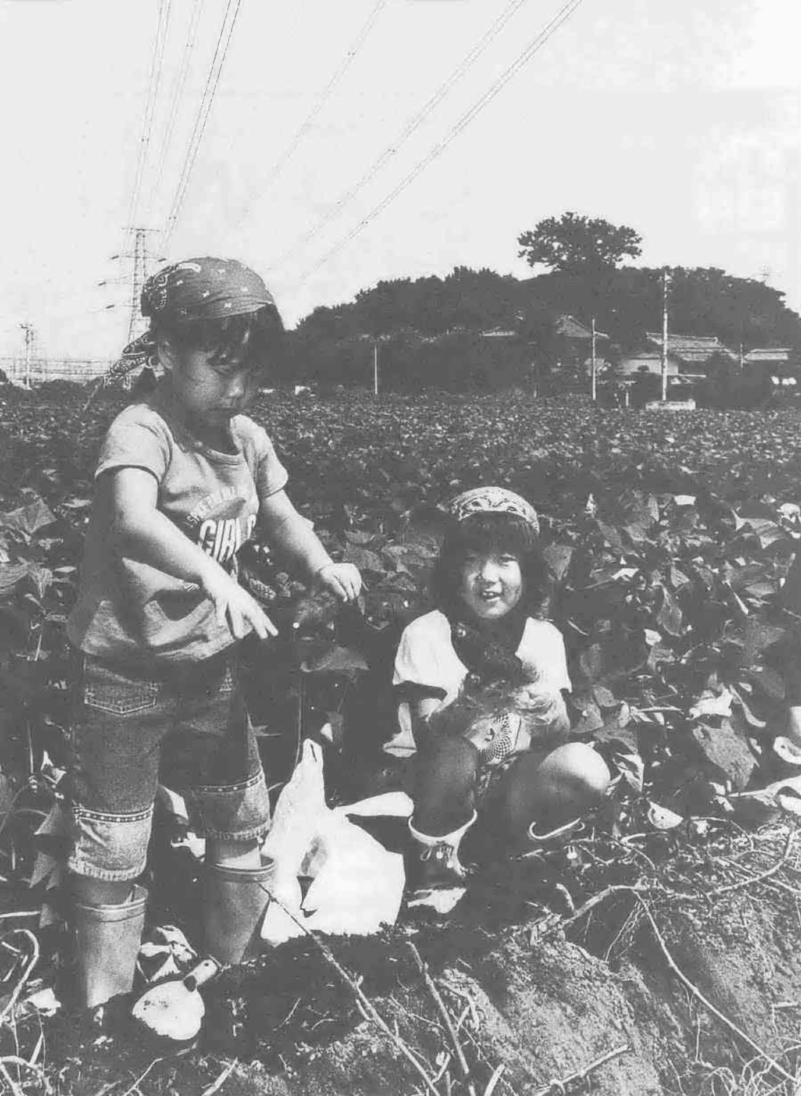
わくわく散歩道シリーズ156 (関連記事は2ページ)