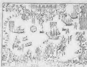
川越藩の警備を伝える、当時の瓦版

10月3日(土)～11月8日(日) 市立博物館 22-5399 22-5396 入館料…大人200円 学生・生徒100円 児童50円 休館日…月曜日・10月23日(金)・11月4日(水)