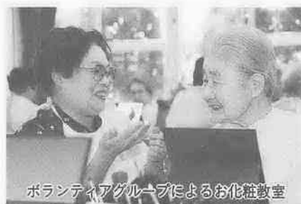
ボランティアグループによるお花教室

10月4日(日)まで・川越まつり 10月5日(月)から・秋立つ小江戸川越 月～木曜日/午前9時45分～・午後0時45分～・午後6時45分～・午後8時30分～ 金曜日 /午前9時45分～・午後0時45分～・午後6時45分～・午後9時45分～ 土・日曜日/午前9時45分～・午後4時00分～・午後6時45分～・午後9時45分～