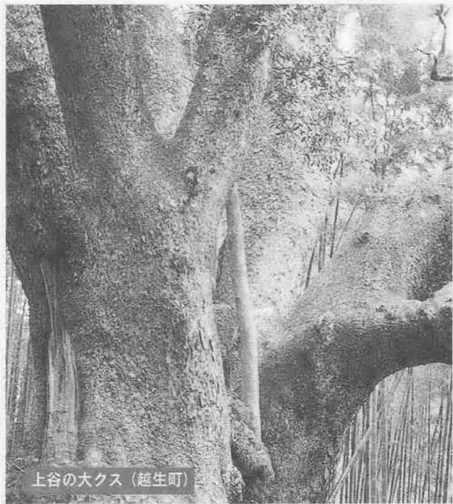
上谷の大クス(越生町)

*レインボーニュースは、埼玉県川越都市圏まちづくり協議会(レインボー協議会)を構成する7市町の広報紙に統一紙面で掲載しています。