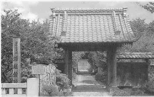
河越館跡の一面にある常楽寺（山門付近）

平安末期から戦国にかけて、数々の興亡を見つめてきた河越館。現在は近くの小学校・幼稚園の子どもたちの声が響き、穏やかな時間が流れています。 *『川越市の文化財（川越市教育委員会）』『川越のあゆみ（川越市）』を参考にしました。