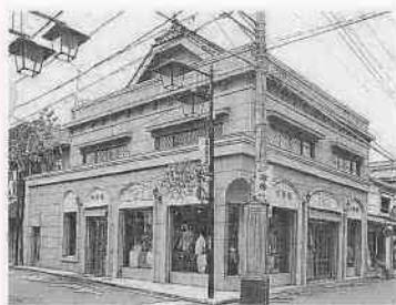
◆大野屋洋品店 連雀町一三二一〇 昭和五年建築

木造3階建の外観は、アール・デコ調の銅板張りで、日本の看板建築の代表作といえる建物。市役所周辺の都市景観にとってシンボリック的存在になっています。