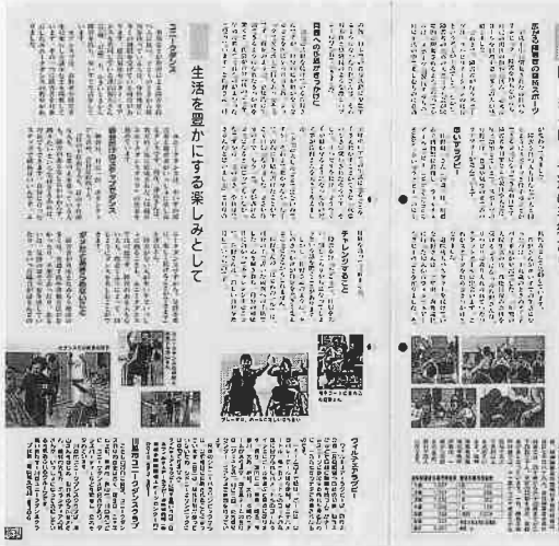
広報川越No972 2・3ページ