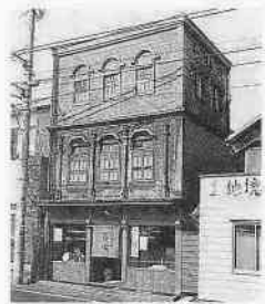
◆手打そぼ百丈 (旧湯宮釣貝店) 元町一丁目一、二五 昭和七年建築

2月16日、市内で初めて、下記の4件を「都市景観重要建築物」として指定しました。