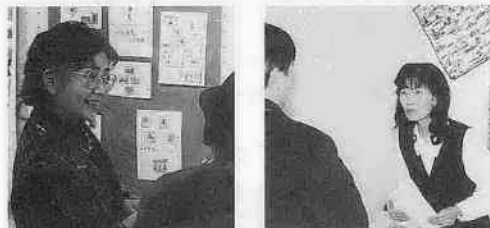
切手展の会場で来場した方々に説明・応対する4人。