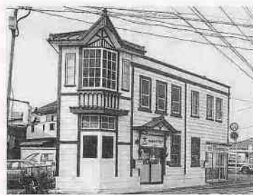
◆カフモク本部事務所棟 (旧六軒町郵便局) 田町五一 昭和二年建築

伝統的な町家造りを踏襲した建物でありながら、昭和初期の特徴である背の高い構造です。熊野神社と一体となって連雀町の歴史的景観を構成しています。