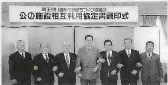
(左から日高市長・鶴ヶ島市長・坂戸市長・川越市長・川島町長・毛呂山町長・越生町長)

二月十六日、川越市・坂戸市・鶴ヶ島市・日高市・川島町・毛呂山町・越生町の四市三町で構成する埼玉東川越都市圏まちづくり協議会(通称レインボー協議会)では、各市町が所有する公共施設の相互利用を、四月一日から開始する協定書の締結式を行いました。これにより、今まで市民・町民に限られていた圏域内の公共施設の利用が可能になりました。また、使用料金も各市町に住む方と同額で利用できます。対象となる施設は、文化施設・福祉施設・体育レクリエーション施設など、全部で九十一施設です。利用方法については、各市町の手続きに基づきます。現在、対象施設ガイドを作成しています。詳しくは、レインボー協議会事務局にお尋ねください。公共施設の相互利用が、圏域住民の利便性の向上と交流機会の拡大につながることを期待します。皆さん、どうぞご利用ください。問い合わせ：レインボー協議会事務局(政策企画課内) ☎内線2114