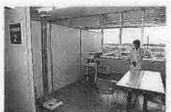
★身長・体重・血圧・脈拍測定