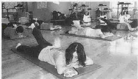
健康づくりトレーニング

また、「いきいき健康体操」は「肩こり・腰痛予防教室」を併せて、「ヘルシー運動教室」と名前が変わります。これらの教室の中で、適度な食事をとるための栄養指導などを行います。さらに生活習慣病予防のための川越市独自の理論を作り、実践していくことで市民の皆さんの健康を守っていきます。 ■総合の意味は? 総合保健センターの所長は、内科を専門とする医師が務めています。かつて、保健婦の資格だけではできない事業もありましたが、今後は保健・医療・福祉に関する事業のほと