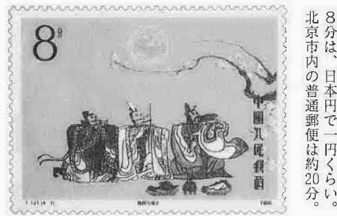
日本人にもファンが多い「三国志」。写真は、劉備・関羽・張飛による「桃園の契り」の場面です。（実物大）