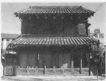
◆小島家 連雀町一八一四 昭和四年建築

和風の瓦屋根に洋風の棟飾りを乗せた独特の屋根形状とやさしさを感じさせる洋風デザインが特徴。大正浪漫夢通りの入り口を飾る重要な建物です。