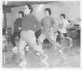
リズム&ストレッチ教室