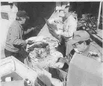
三光町自治会の集団回収風景

ごみの資源化・減量化に有効な手段の一つとして、集団回収があります。三光町自治会では、ごみの減量・資源化を進めると同時に、地域の活動資金を得るために、平成九年度から集団回収を開始し、毎月一回実施しています。定期的に続けるコツを自治会に伺うと「役割分担をしっかりとし、連絡を取り合う」とのことでした。