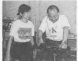
健康づくりトレーニング