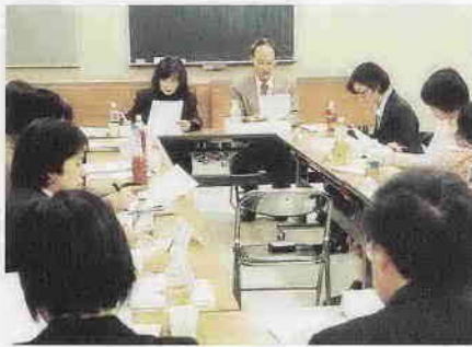
「外国人が困っていること」をテーマに行われた外国籍市民会議の様子。 (南公民館・1月29日)