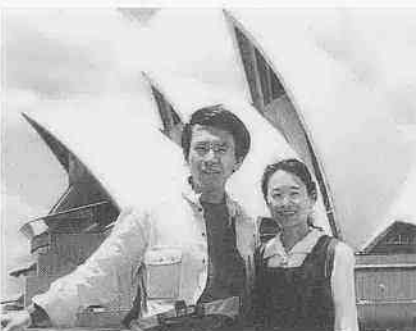
オペラハウスをバックに記念撮影

「うわあ、海が輝いているよお」。飛行機酔いをふきとばしてしまうほどの絶景は、これからの旅の素晴らしさを物語っているようでした。昨年6月、幼なじみと電撃結婚し、11月末に念願のオーストラリアに行きました。海外旅行は初めてだったので不安いっぱいでしたが、無事シドニーに着き、気分はパラダイス！ シドニー湾でランチクルーズ、オペラハウス見学。ブルーマウンテンに行き、「スリーシスターズ」を見ながらハイキングしたり、傾斜45度もあるトロック列車に乗ったりしました。一帯に茂るユーカリの香りが気分をリフレッシュしてくれました。オリンピック会場横を歩いてリスペンへ行き、コアラと記念写真。ゴールドコーストへ行き、果てしないビーチ、光輝く波に感動。シーワールドでイルカショーを見たり、夜はカジノへ出かけたりしました。片言の英語とジェスチャーでしたが、オーストラリア人の明るく親切な人柄に心温まる思いがしました。「帰りたくないよお」と思うほどの充実した楽しい旅。また、行きたい国でした。*ふりがなは広報室でつけました。