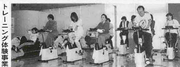
トレーニング体験事業

化のための運動や整理体操(クールダウン・リラクゼーション)を行います。 このトレーニング教室を始めた高血圧症の方が、血圧値が安定するといった効果が出ている例もあります。ほかにも自己流で運動していた方が、この教室に参加してストレッチを覚えてからは、筋肉痛や疲れが軽減したなどの効果もありました。 県内でも、こうしたトレーニング教室を行っている市町村は、そう多くありません。 ■健康づくりのための運動教室 運動習慣を身に付けたい人や運動を始めたばかりの人を対象に、リズム体操とストレッチ体操を行う「リズム&ストレッチ」、運動の基本である歩くことを学ぶ「ウォーキング」、ストレッチ体操・マット運動・ウォーキングに肩こり・腰痛体操も合わせた「ヘルシー運動教室」などを実施しています。また総合保健センター以外でも、「ここに運動教室」を行っています。