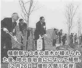
植樹祭で3本の苗木が植えられた後、地元自治会によって植樹。（2月26日・増形入間川右岸）

現在、観光課では、川越市内の桜を案内する「さくらマップ」を編集中です。詳しくは11ページをご覧ください。