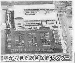
空から見た総合保健センター