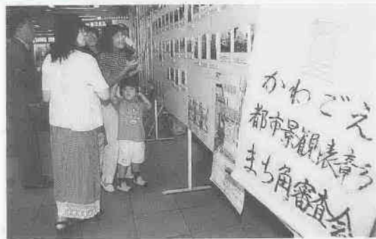
「小江戸川越景観賞」は、市民の審査と専門家の審査をあわせて検討し、選ばれます。 (9月14日・本川越駅構内)

「パークアンドライド」って何? 川越市が市内の自動車渋滞緩和のために実験として試行する「パークアンドライド」の概要についてお伝えし、今後の交通政策を考えます。ほかに、まちかど審査会、ほろ祭りの様子など、市内の出来事をお知らせします。