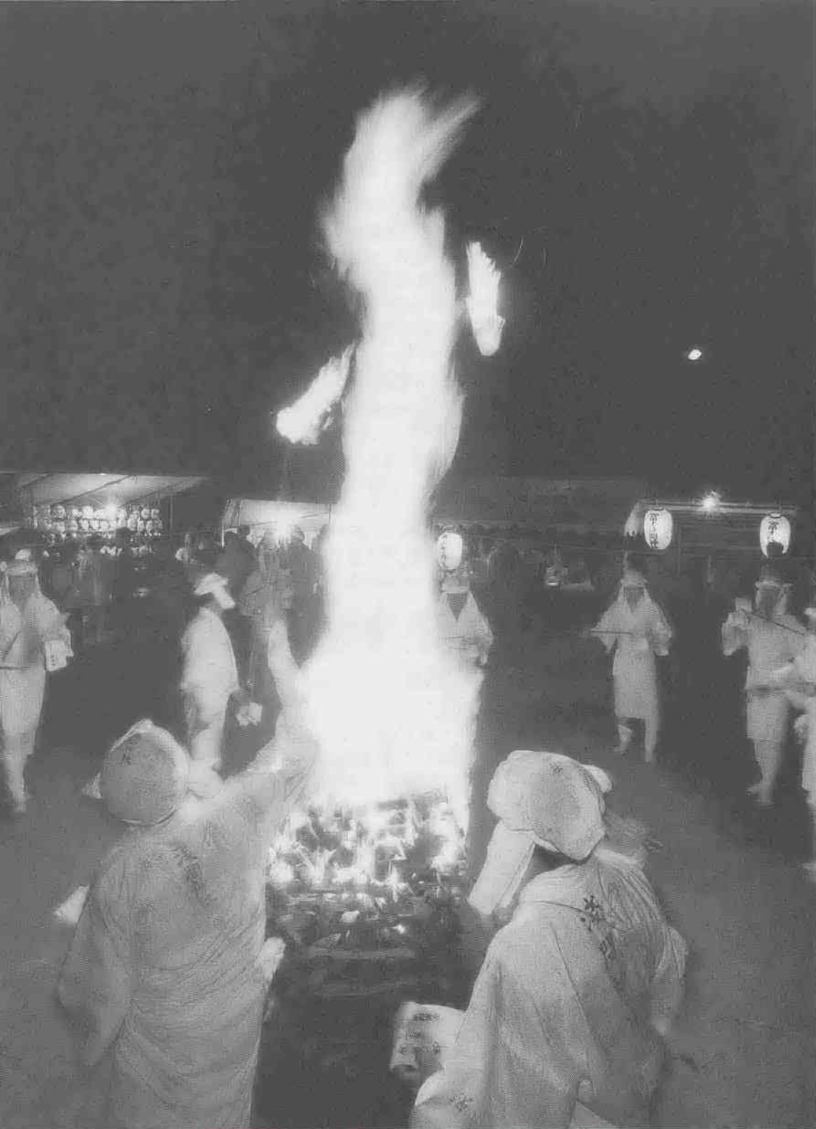
わくわく散歩道シリーズ180 (関連記事は8ページ)