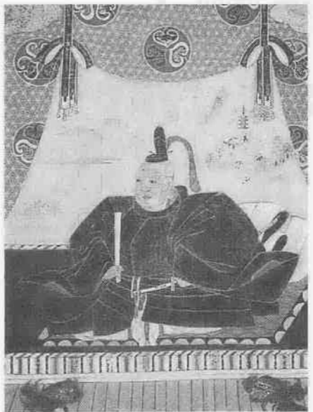
東照大権現像(部分・川越市蔵)

この特別展は、家康・秀忠・家光の時代の川越を、市内に残されている貴重な江戸前期の資料でたどります。