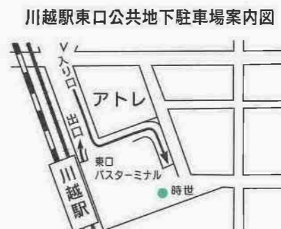
*駐車場への入り口は、アトレの南側です。

土曜日・日曜日・祝日の昼間、川越駅周辺は、観光や買い物のため、車が多くなり、渋滞がひどい場合があります。平日についても、渋滞を少しでも緩和するため、川越駅東口公共地下駐車場をご利用ください。 利用時間：午前7時～午後11時(1月1日(祝)は休業日) 料金：三十分ごとに百二十円(消費税) 十円未満は切り捨て *午後十時から翌日午前八時まで、千二百六十円(税込)です。 回数券 三十分券(十一枚つづり) 二千二百六十円 二時間券(十一枚つづり) 二千五百二十円 プリペイドカード 五千円(三十分券四十七枚相当) 問い合わせ：川越駅東口公共地下駐車場料金所 ☎26-0081