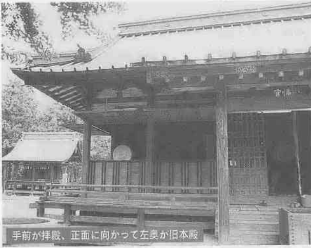
手前が拜殿、正面に向かって左奥が旧本殿

現在の社殿は、棟札から古尾谷庄十三村が施主となり、享保七年(一七二二)に完成。本殿と拜殿を幣殿でつないだ権現造りで朱塗りの外観を持ち、本殿と幣殿の周りには透塀が巡らされています。本殿は、正面三間、側面二間。屋根は入母屋造り銅板葺きで千木と鰹木が載り、蟄股、龍の彫物の脇障子、深い軒を支える組物など堂々としたものです。拜殿は正面六間、側面一間。屋根は入母屋造りで大正十三年に旧本殿同様、瓦葺きを銅板葺きに変更しました。正面には二間の向拝が付き、開口部は薮戸になっています。本殿内部には入母屋造りで正面には唐破風、千鳥破風が付き、極彩色が施された宮殿があります。