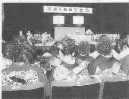
受付で記念品を受け取って大ホールに入場

国民の祝日に関する法律の一部改正により「成人の日」が一月の第二日曜日になり、市では、一月八日に「第五十二回川越市成人式」を行います。 今回、対象となる新成人は、昭和五十五年四月二日から同五十六年四月一日までに生まれた市内在住の方です。該当者には、十一月末までに案内状を送り、成人式当日に会場内で案内状と引き替えに記念品を贈呈します。 式は、住所によって時間が異なるうえ、会場の市民会館周辺は、たいへん込み合います。時間に余裕をもってお越しください。 新成人の希望や抱負による「20歳のメッセージ」の締め切り(十二月一日(金))が迫っています。皆さんの夢のあるメッセージをお届けください。 問い合わせ: 生涯学習課社会教育係 ☎ 内線 2842