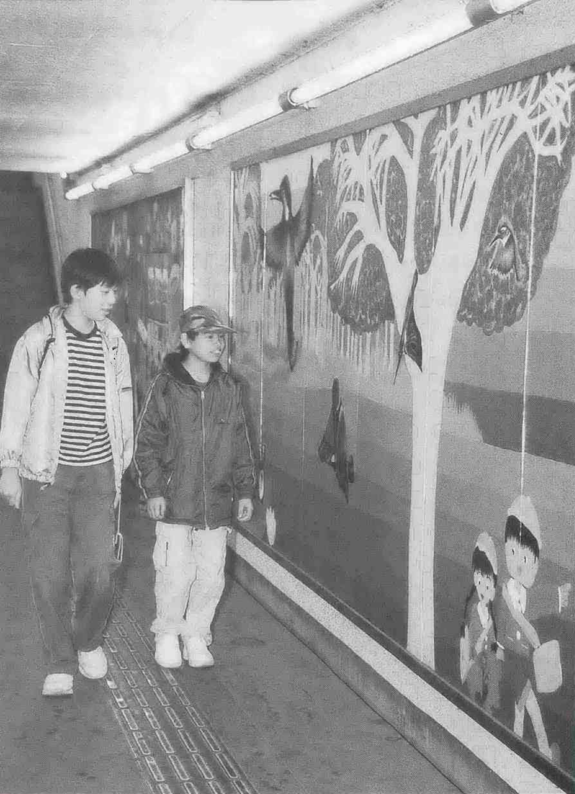
わくわく散歩道シリーズ182 (関連記事は6ページ)