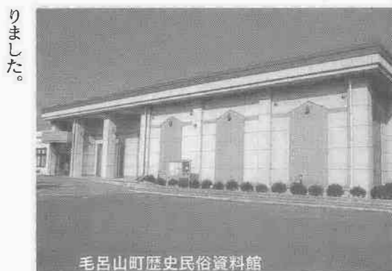
毛呂山町歴史民俗資料館

街道も整い、家康を祭った日光東照宮を警護する八王子千人同心は、日高市・鶴ヶ島市・坂戸市を南北に走る日光街道を通行して任務に当た