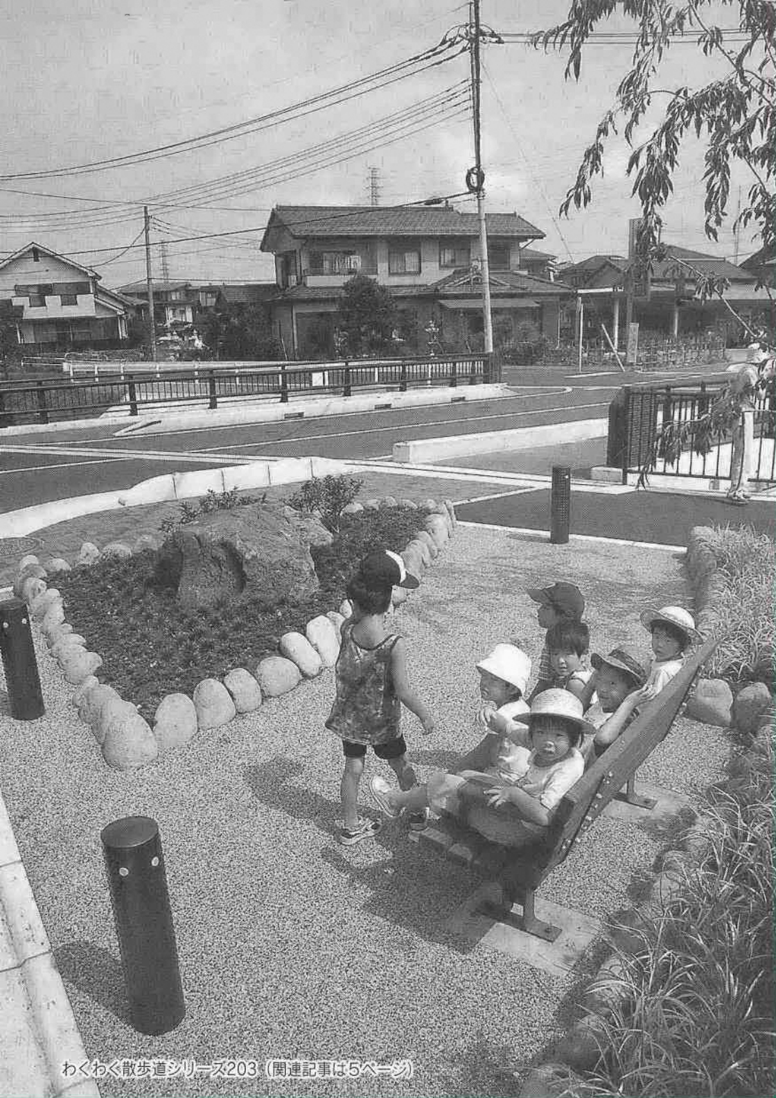
わくわく散歩道シリーズ203 (関連記事は5ページ)