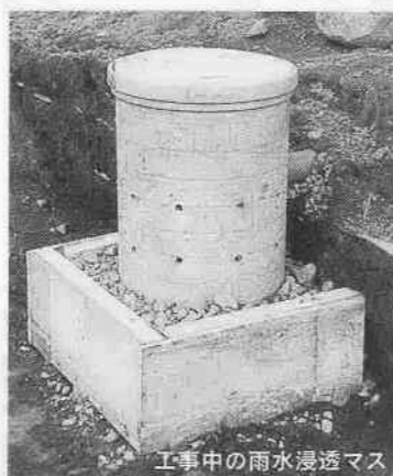
工事中の雨水浸透マス