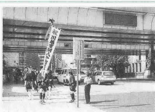
日本橋を出発する上使行列の一行 (7月27日)

先日行われた上使行列に2日間同行しました。100人を超える応募者から選ばれた19歳から75歳までの30人が、21人ずつ交代で川越街道47キロを歩きました。沿道の14区市町から市制施行80周年の祝いの親書を頂きながらの行列です。朝からの猛暑の中、中央区長から祝辞を受け取り、日本橋を出発しました▶行列を支えたスタッフは22人。14区市町で行った親書伝達式典はものの10分足らずなのに、式典に参加した首長等5人のかみしも・はかまの着替えをはじめ、会場の設営、行列の誘導など、手際よくこなしていました▶それにしても歩くのが早いこと。同行するのめたいへんでした▶都心から離れ川越街道の面影が濃くなると、テレビ放映や新聞報道の影響が沿道で声援を送る人の数は増えていきました。市内だけでなく、市外に住む大勢の皆さんにも市制施行80周年を祝っていただきました。14区市町の皆さん、そして上使行列を支えてくれた皆さん、ほんとうにありがとうございました。