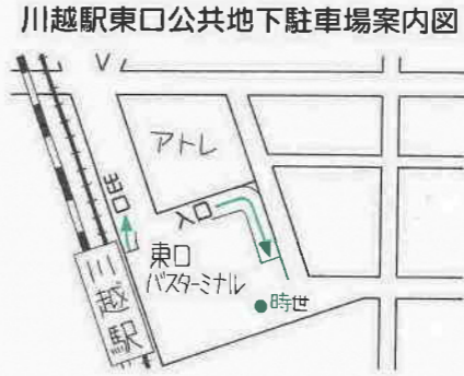
*駐車場への入り口は、アトレの南側にあります。

最近、川越駅周辺の違法駐車が増えています。違法駐車は、渋滞を引き起こす原因となったり、自転車・バイクなどの通行の妨げとなったりします。