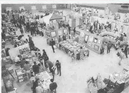
11月9日・10日、川越運動公園で行われた'02さんばくの様子

十二月一日の市民の日で八十歳を迎える川越市。番組では、市制施行八十周年記念事業を振り返ります。また、十二月にオープンする川越市北部地域ふれあいセンターやクレアパークなども併せて紹介します。