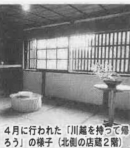
4月に行われた「川越を持って帰ろう」の様子（北側の店蔵2階）

大正年間に板ぶきの町屋を取り壊して作られたようで、二階の窓には一枚ガラス戸をはめ込み、一般の蔵造りとは対照的な作りとなっています。また、敷地全体を土蔵壁の建物で囲い、建物全体で火を防げるように造られています。