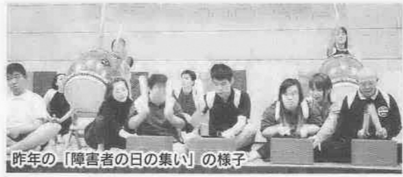
今年の「障害者の日の集い」の様子

12月8日(日)、午前10時~午後3時 福祉機器の展示 展示日程は「障害者の作品展と即売」と同じです。