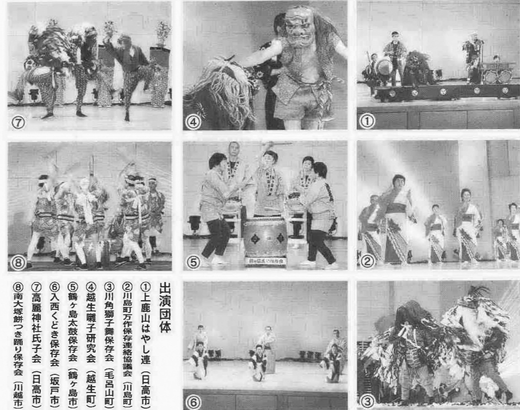
出演団体 ①上鹿山はやし連(日高市) ②川島町万作保存連絡協議会(川島町) ③川角獅子舞保存会(毛呂山町) ④越生囃子研究会(越生町) ⑤鶴ヶ島太鼓保存会(鶴ヶ島市) ⑥入西くどき保存会(坂戸市) ⑦高麗神社氏子会(日高市) ⑧南大塚餅つき踊り保存会(川越市)

レインボー協議会が実施する事業について、ご意見・ご要望がありましたら、埼玉県川越都市圏まちづくり協議会事務局(川越市政策企画課)または各市町の企画担当まで、ご連絡ください。 問い合わせ 埼玉県川越都市圏まちづくり協議会事務局 川越市政策企画課 ☎049-224-8811内線2115 〒350-8601川越市役所政策企画課