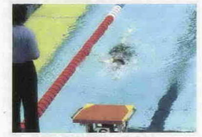
わかふじ大会で力泳する新聞さん。背泳ぎは自己記録を更新しました