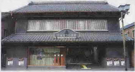
昨年9月にオープンした川越まつり会館

私は、まちづくりにとって地域を支えるコミュニティはたいへん重要なものであると認識しております。地域の皆様の活動拠点である自治会集会所および老人憩いの家の整備に対しては、引き続き補助してまいります。