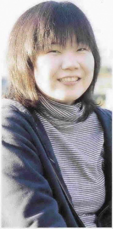
新聞さん。50m自由形と50m背泳ぎで金メダルを獲得