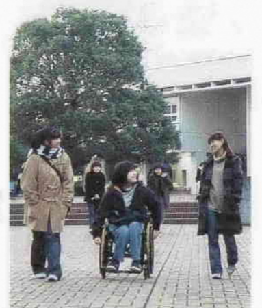
大学での新聞さん。講義が終わって、ほっと一息。友人たちとの会話に笑顔がこぼれます

二十歳になったことについて、「あまり実感がわきません。今までは、とても早かったと感じています」と新聞さん。四月からは卒業論文や就職活動の準備で忙しくなります。ますます練習量が減ってしまいうそうです。でも、「ことしは地元での大会なので、何とか時間をやりくりしてまた一番になりたい。公務員になりたいので、勉強も頑張ります」という力強いことばに、これからの意気込みを感じました。