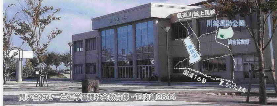
問い合わせ…生涯学習課社会教育係・TEL内線2844

この日の成人式は、1月12日(祝)、川越運動公園総合体育館で行われます。受け付けの際に記念品を贈呈しますので、昨年11月末に送付した案内状を忘れずに持参してください。当日は、会場周辺の混雑が予想されます。余裕をもってお越しください。川越駅東口・本川越駅からは、無料送迎バス(午前10時ごろから1時間に4便程度)を運行します。 受付時間…正午～(式典＝午後1時～) 対象…昭和58年4月2日から同59年4月1日までに生まれた市内在住の方