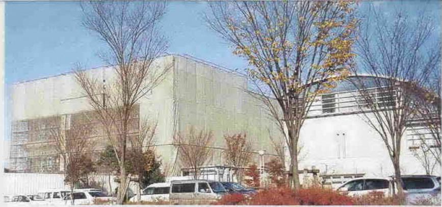
総合保健センター西側に建設中の川越市保健所