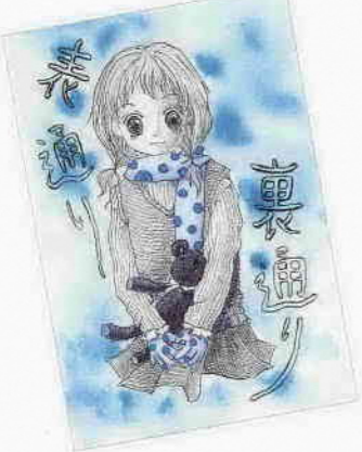
まりも(17歳・久保町)

募集 「旅の空から」(400字程度) 「イラストコーナー」 〒350-8601 川越市役所広聴広報課