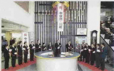
昨年4月1日に行われた中核市移行式

地方分権がいよいよ実行に移される段階となりました。数多くの事務権限を持つことができたこと、中核市に移行することができましたことは、本市の歴史上面的な出来事です。同時に川越市政発展にとって、たいへん重要な意義を持つものでございます。