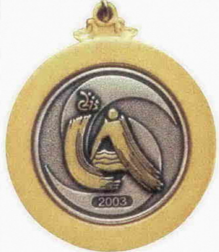
わかふじ大会の金メダル(実物大)

ち続けていました。一年前に現在のコーチと出会い練習を再開。大学に通いながらでは、練習は週一回の二時間しかできず、万全の状態では大会に臨めませんでした。大会の感想を聞くと、「金メダルが二つとれたので満足しています。自由形で自