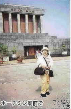
ホーチミン廟前で

亜熱帯独特の蒸し暑い気候の中、ハノイからホーチミンまで、南シナ海岸に広がる素晴らしい景色を眺めながら移動した。その間、水牛と共に米の収穫に忙しく働く農民の姿や、世界遺産にもなったミーソン遺跡の見学、1953年ごろ日本人によって作られたという日本橋はシクロに乗っての見学だった。おいしいベトナム料理に舌鼓を打ち、みことなスタイルで純白のアオザイを風になびかせてバイクに乗る女学生等々、ベトナムらしさを満喫した。