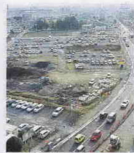
現在の川越駅西口

鉄道を利用される皆様の利便性を向上するため、JR川越線の部分複線化について、調査検討いたします。市内循環バス「川越シャトル」につきましても、運行本数やコースを見直し、公共交通として、より多くの皆様にご利用しやすい環境を整えてまいります。 かつて川越は、新河岸川の舟運により江戸との結びつきを深め、大きく発展してまいりました。その歴史を今にとどめる、仮称仙波河岸史跡公園の整備が進み、今春オープンいたします。自然と歴史に親しみ、安らぎを感じることができるよう、広さ一・一へ