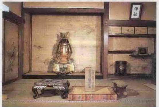
喜多院にある家光誕生の間

輝かしい歴史と貴重な文化的遺産が数多くある本市は、観光でも脚光を浴びております。昨年は、川越まつりの雰囲気もいっつも味わえる川越まつり会館がオープンいたしました。また、東京で行われた「江戸天下祭」に志多町の「弁慶の山車」が参加し、小江戸・川越を大江戸でアピールいたしました。ことは、江戸幕府の三代将軍・徳川家光が誕生して四百年に当たります。本市には喜多院の「家光誕生の間」等があり、これを契機に、さらに川越を全国にアピールする事業を実施してまいります。