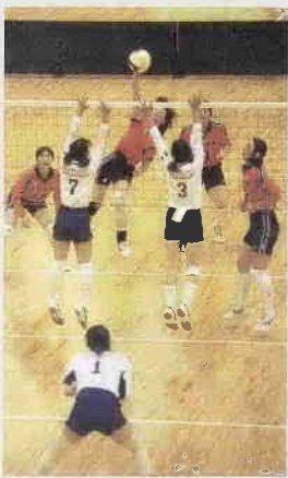
昨年8月に総合体育館で開催された「彩の国まごころ国体」リハーサル大会（バレーボール）

「彩の国まごころ国体」はことし、いよいよ本番を迎えます。本市でも、夏季大会でゴルフとサッカーが、秋季大会でバレーボールと高校野球