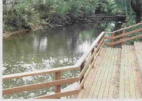
仮称仙波河岸史跡公園 (仙波町4丁目)

(軟式)の四競技が開催されますので、大会の成功に向け全市をあげて取り組んでまいります。 まちづくりは、将来川越がどのように発展していくべきかを見極め、総合的・計画的に行われなければなりません。 私は、十年後二十年後の本市のあるべき姿を見据え、都市基盤整備にいつその力を注いでまいります。 街路事業につきましては、市立博物館前の三田城下橋線、川越駅東口の通称アカシア通りと呼ばれる市内循環線等の整備を進めるとともに、その他の幹線道路につきましても順次整備を推進いたします。また、市民の皆様から要望の多い生活道路につきましても、積極的に整備を推進してまいります。 市内にある駅周辺の整備につきましては、霞ヶ関駅の北口開設が、地元の皆様のご協力により、いよいよ目に見える形となつてまいりました。エスカレーターの設置を含め、引き続き、早期開設に向けて努力いたします。また、川越市駅・本川越駅周辺地区につきましても、地元の皆様との合意形成を図り、整備を推進してまいります。さらに、川越駅では、西口駅前広場の改善計画の策定を進めてまいります。