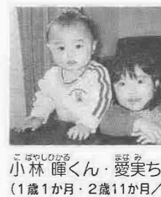
仲よし師弟。よろしくね!