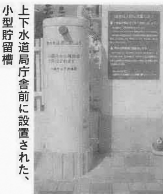
上下水道局庁舎前に設置された、小型貯留槽