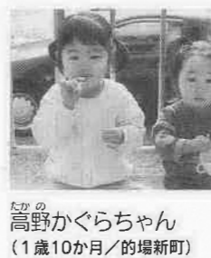
美那お姉ちゃん、大好き♡