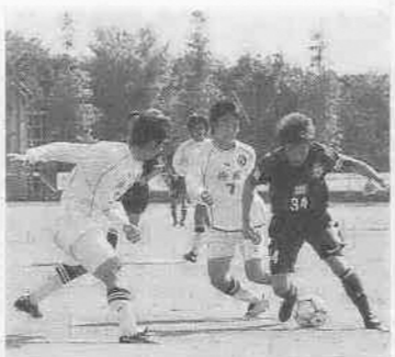
「彩の国まごころ国体」はことしが本番(写真は昨年のリハーサル大会)

支援する市民文化振興の施設として平成十四年に市立美術館を開館しました。また、国内三市町村、海外三市と姉妹友好都市等の交流活動を行っています。 国際性のある人づくり、まちづくり 外国籍市民の皆さんが市政に対し意見を述べる機会を提供するため、外国籍市民会議を設置しました。同会議は、平成十四年七月に開催した国際交流センターの導入機能や実施事業等に大きな役割を果たしています。