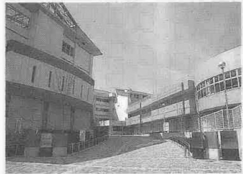
霞ヶ関北小学校・西図書館・伊勢原公民館

「川越市生涯学習基本構想・基本計画」に基づき、学習機会や情報提供の充実など、生涯学習の推進に努めています。 地域の生涯学習活動の拠点として、さわやか活動館や、霞ヶ関北小学校との複合施設である伊勢原公民館を設置しました。今後は、仮称高階地区公共施設と仮称名細地区統合公民館等の整備を推進していきます。