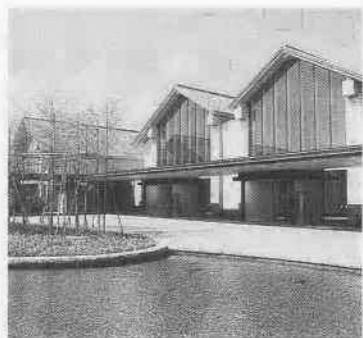
市民聖苑やすらぎのさと