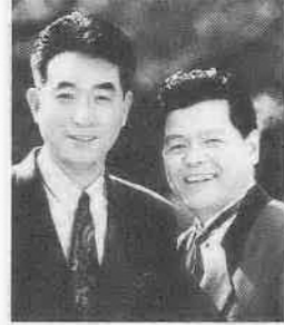
チャーリーカンパニー