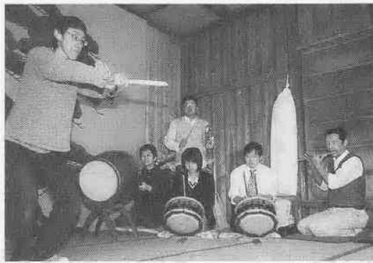
囃子の練習風景（熊野神社・連雀町）

十九台の山車に参加して、十月十六日・十七日に行われた川越まつり。その様子をさまざまな映像を交えてお伝えするとともに、川越のまつり囃子における演奏の特徴や楽しみ方などについて紹介します。