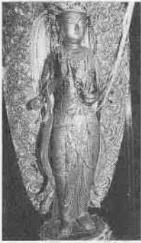
木造正観音菩薩立像

この像は江戸時代に大きな修理が施され、光背や台座などもその際補われました。顔や腕も手直しされたため、表情にやや近世的な硬さが見られますが、全体的な立体構成などから鎌倉時代初期ごろに、定朝様式の流れをくむ旧派仏師が製作したものと考えられます。川越地方に伝来する平安・鎌倉時代の仏像の中でも、特に都風に洗練された美しい作品です。