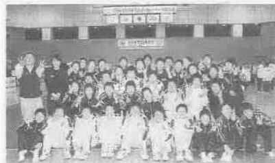
上・バレーボールで優勝した長崎県