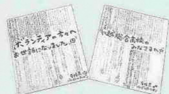
選手から送られたお礼の色紙

市内で行われた2競技の選手の皆さんは、高校の合宿所を宿舎として利用しました。各宿舎では、小江戸川越まごころステイ協会の皆さんが食事の提供や清掃など、選手が試合で実力を発揮できるよう、まごころを込めてお世話をしました。選手と協力会、お互いの交流が深まり、思い出深いものになりました。