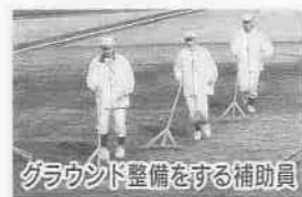
グラウンド整備をする補助員