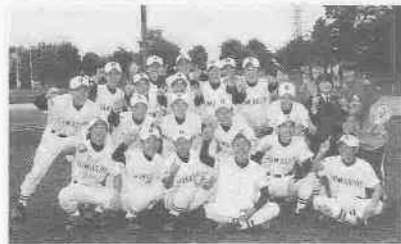
下・高校野球で優勝した浜松商業高校