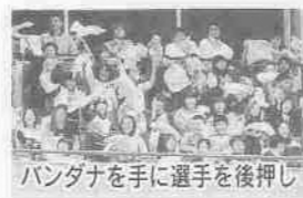
バンダナを手に選手を後押し