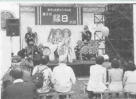
喜多院縁日大会 (11月7日)

娘が七五三を迎え、道を歩いていると通りかかった方から「おめでとございます」と何度か声を掛けられました。親として、そして川越のまちの温かさにうれしくなりました▶昨年12月に、このコーナーで市内の紅葉がきれいな場所について伺ったところ、情報を3件頂きました。今度紹介しようと、様子を見に出かけました▶最初に、彩の国まごころ国体の会場となった川越運動公園。今は静かに散策できます。紅葉を探すと、ケヤキに赤く色づいている部分がありました。次に、小畔川に架かる吉田橋の下流に出かけました。川沿いにある保育園のイチヨウは、まだ緑色でした。最後に、川鶴団地の中にある上丹草公園へ。イチヨウの周りにカエデが植えられていて、木々の距離がいい感じです▶木枯らしが心配なこれから。時々様子を見に出かけ、いちばんきれいな紅葉をお伝えしたいと思っています。