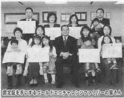
認定証を手にするゴールドエコチャレンジファミリーの皆さん

三つのチャレンジコースをすべて修了すると、「ゴールドエコチャレンジファミリー」として認定されます。今回、初めてのゴールドエコチャレンジファミリーとして、次の九家族の皆さんを認定しました。