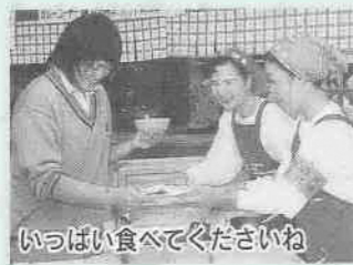
いっぱい食べてください