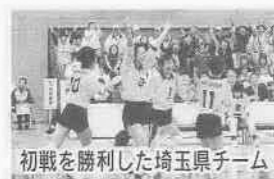
初戦を勝利した埼玉県チーム