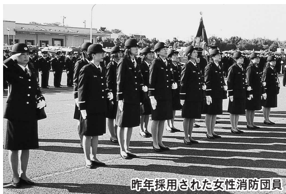
昨年採用された女性消防団員

川越市消防団では、より地域 に密着した防火・防災活動を推 進する、活動的な女性消防団員