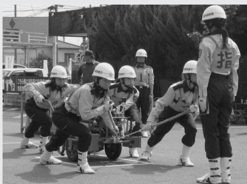
軽可搬ポンプ操法の訓練に励む女性消防団員

川越市消防団の女性消防団員は、埼玉県下八十五消防 団の代表としてこの大会に出場するため、日々厳しい訓 練を実施しています。