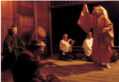
昨年の様子。最も古い面は、13代受け継いでいるそうです