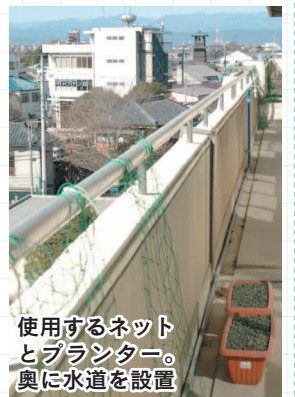
使用するネットとプランター。奥に水道を設置