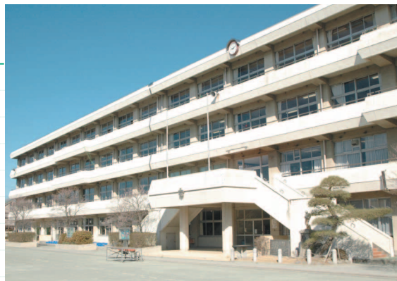
川越小学校の、主に正面左側の部分が緑化されます