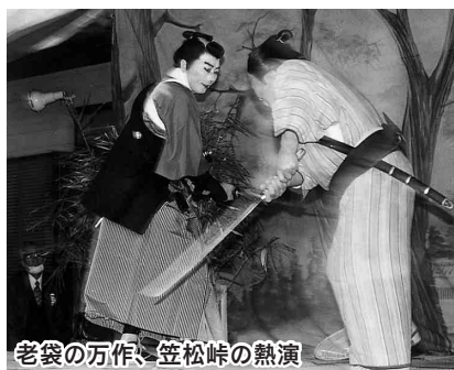
老袋の万作、笠松峠の熱演