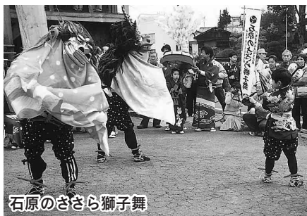
石原のささら獅子舞