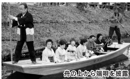
舟の上から端唄を披露