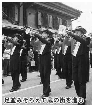
足並みそろえて蔵の街を進む