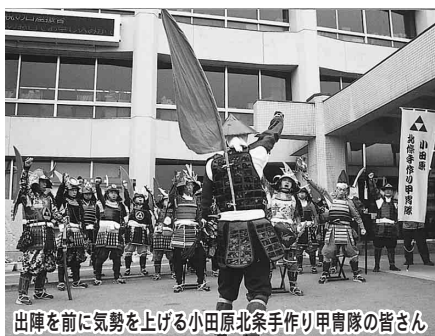
出陣を前に氣勢を上げる小田原北条手作り甲冑隊の皆さん