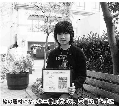
絵の題材になった三番町付近で、受賞の盾を手に入

スをやってみたい」と語ります。絵も続けるため、これから忙しい毎日になりそう。「何事にも努力する」という目標を胸に、中学校での生活を楽しみにしています。