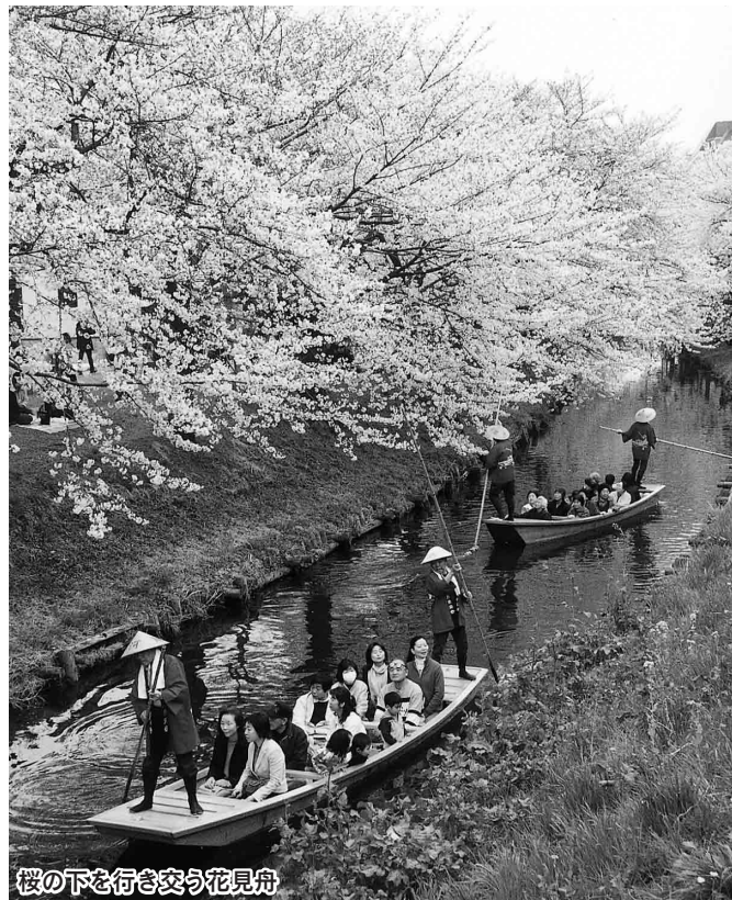
桜の下を行き交う花見舟