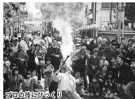
フリの技にびっくり