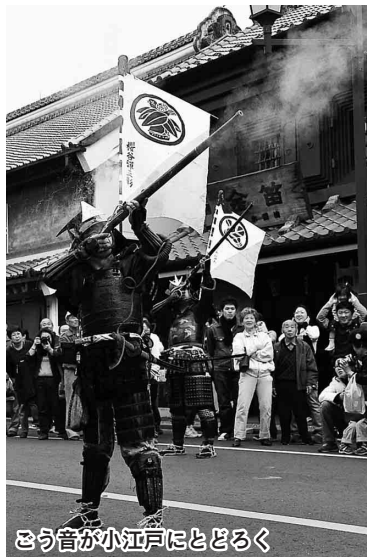
さう音が小江戸にとどろく