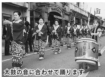
太鼓の音に合わせて踊ります