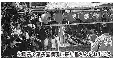
お囃子で菓子屋横町に来た皆さんをお迎え