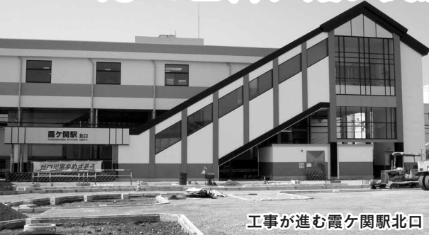
工事が進む霞ヶ関駅北口

霞ヶ関駅北口が、7月15日(土)に開通します。式典終了後に、北口駅前広場と県道川越越生線に接続する道路も使用できるようになります。