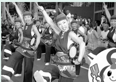
昨年の様子（上）と、イメージキャラクター「さかっち」（右）

会場…前夜祭＝坂戸駅南口／本祭＝坂戸小学校ほか 問い合わせ…坂戸市商工労政課 ☎049-283-1331